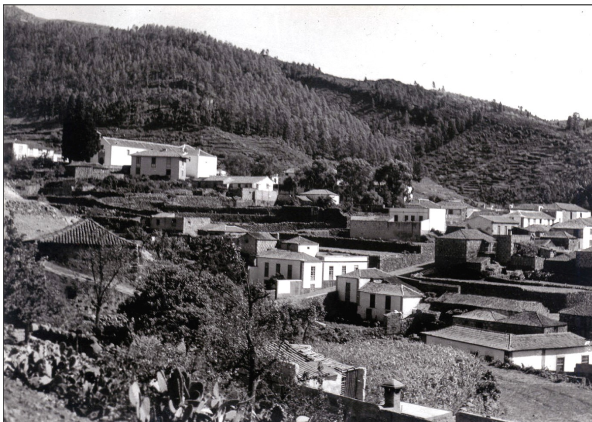
Vilaflor de Chasna. [Imagen del Centro de Fotografía “Isla de Tenerife”].

En el período estudiado, en el Juzgado Municipal de Vilaflor de Chasna existieron, por lo menos, 18 jueces municipales titulares y 14 fiscales municipales, además de otros tantos suplentes, así como numerosos adjuntos del tribunal municipal, 5 secretarios y numerosos “acompañados” o “actuarios”, que cubrían las vacantes de los anteriores. Es normal que muchos de los jueces y fiscales que alcanzaron la titularidad fuesen con anterioridad suplentes, pero llama la atención que varios de ellos ostentasen dos de dichos cargos, pues fueron jueces y fiscales o jueces y secretarios del Juzgado. También resulta llamativo que ninguna mujer desempeñase por entonces esos cargos.