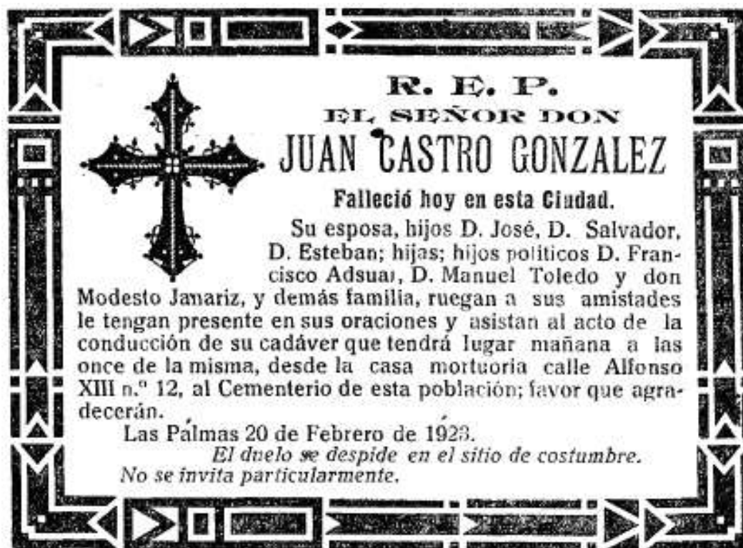
Esquela publicada en Diario de Las Palmas el 20 de febrero de 1923.

En la misma edición, el citado periódico publicaba una esquela, según la cual “ El duelo se despide en el sitio de costumbre ” y “ No se invita particularmente ”. A las once de la mañana del día siguiente se efectuó la conducción de su cadáver, desde la casa mortuoria al cementerio de dicha capital, donde recibió sepultura.