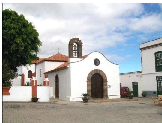
A la izquierda, en el centro de la imagen, el antiguo convento franciscano de Adeje, del que fray Francisco Duranza fue guardián. A la derecha, la ermita (hoy iglesia) de Arico el Nuevo, de la que fue capellán.