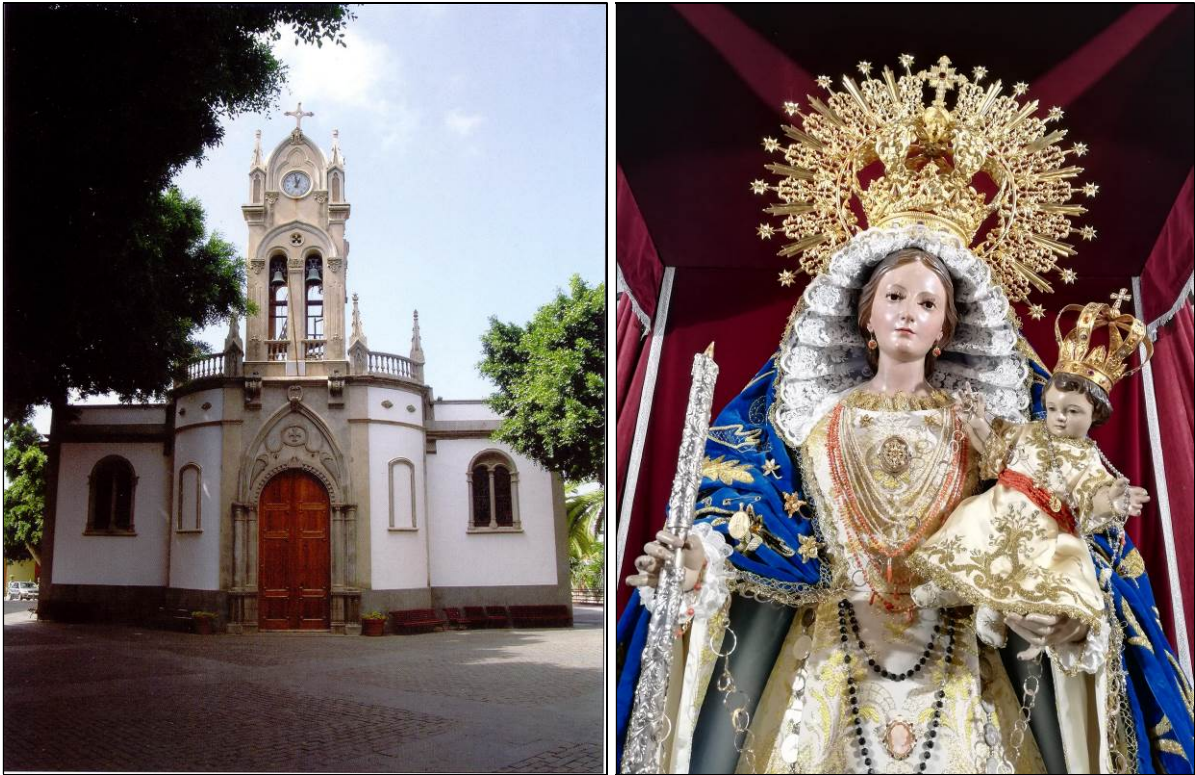
La iglesia parroquial matriz de Ntra. Sra. de la Luz de Guía de Isora y su imagen titular, la venerada Virgen de la Luz.

Todos los núcleos de población de Guía de Isora se engalanaron con esmero para recibir a la venerada imagen de la Candelaria. A lo largo de los dos días de permanencia de la ilustre visitante en el término municipal, se llevó a cabo un apretado programa de actos en cada una de las parroquias.