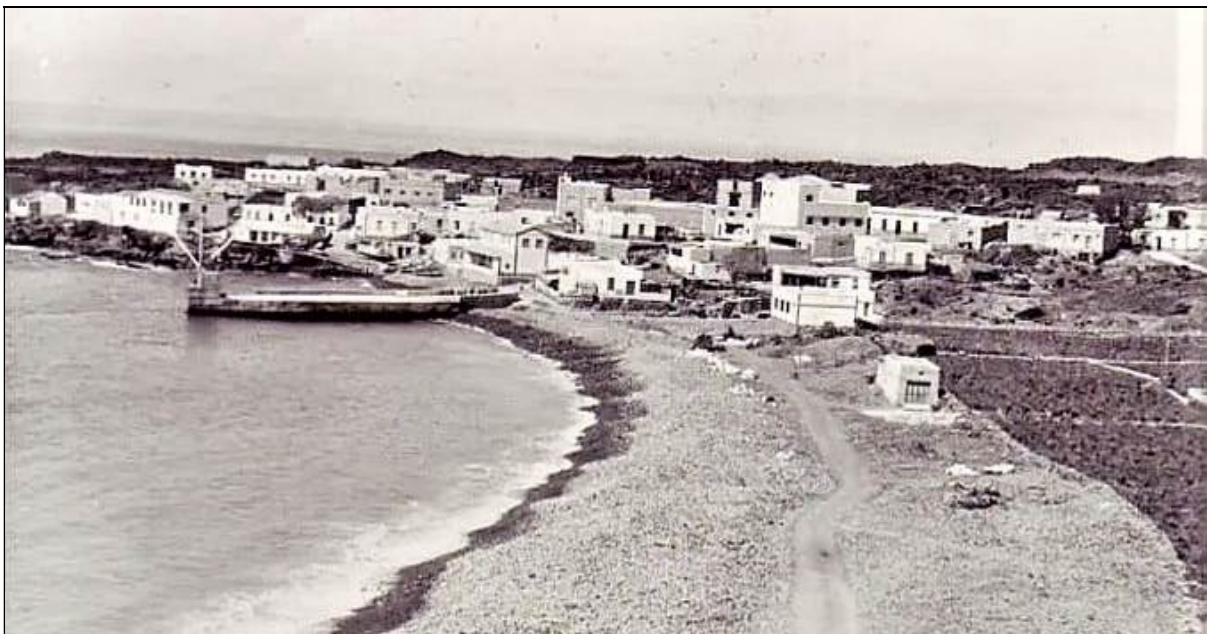
Playa de San Juan, en la costa de Guía de Isora.

Los hombres de la Playa de San Juan dieron buena nota de su religiosidad con aquellas Avemarias entonadas a todo pulmón y también rociadas por ese manantial inagotable de sensibilidad canaria que aflúa con regusto a los ojos, por lo que presenciaban y era motivo de agradecimiento y también porque en toda vida hay algo de lastre que nunca se reconoce mejor que cuando es la Señora de la Candelaria la que toca con su gracia. Allí estaban los hombres regalando los oídos de la Santísima Virgen con el canto dialogado de un “Dios te salve” vigoroso y viril para completarlo luego las mujeres con el “Santa María” dulce y suave como es el acento de voz de todas las isleñas. La carroza a duras penas puede desprenderse de aquella multitud que hubiera considerado como la mayor gracia de su vida el que la Virgen se quedara aquella noche entre ellos. Ahora es una nube de pañuelos blancos los que se agitan cara al cielo en son de despedida. La Virgen inicia su peregrinar satisfecha y pese a que es de noche, a la distancia y penosa subida, la inmensa mayoría de los allí presentes, que eran todos, arrancan tras la Virgen de sus amores y entran haciendo escolta como peregrinos también a la divina Peregrina. En las páginas de esta breve reseña se quedará escrito el nombre de un pueblo que supo entregarse de lleno a la Señora y Reina de Canarias, y los hijos de la Playa de San Juan conservarán el recuerdo perenne de esta visita que pasará de generación en generación. 7