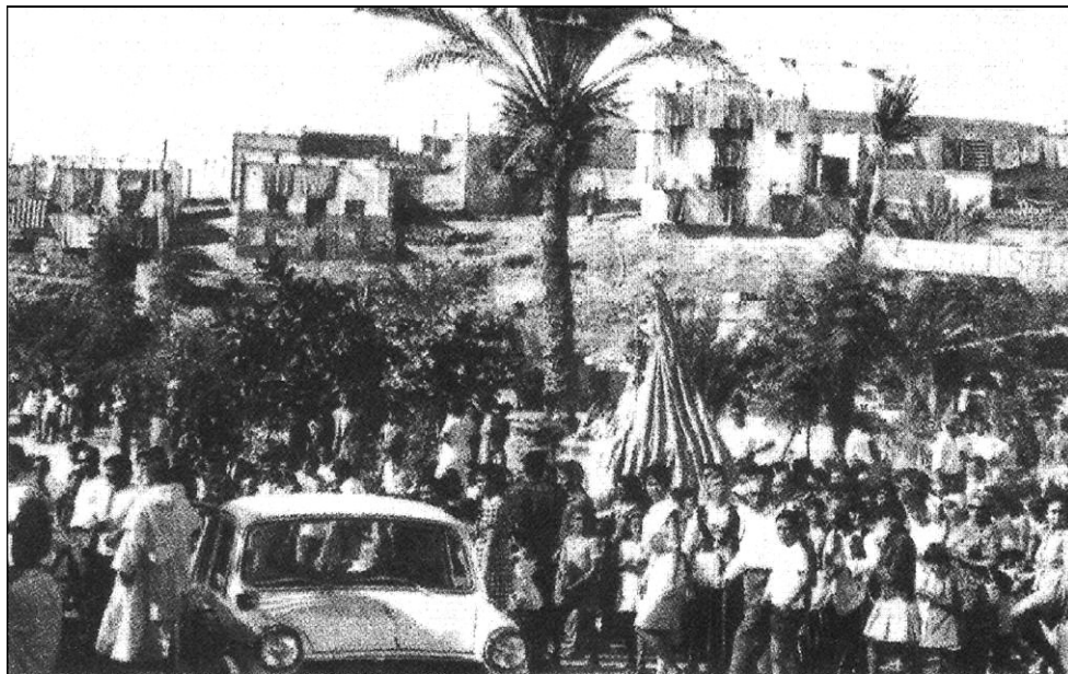
La Virgen de Candelaria en el Puerto de Alcalá, entre el vecindario.

Dos horas solamente permanecería la Santísima Virgen en Alcalá, muy poco tiempo, desde luego para lo que estos excelentes habitantes se hubieran merecido y hubiera sido su deseo; pero el suficiente para poder descubrir ese fenómeno de la profunda religiosidad de los isleños que en esta ocasión se puso al rojo vivo en el Puerto de Alcalá y que en nombre de todos los presentes pusieron a las plantas de la Señora los Capellanes, P. Isaías y P. Juan, en sendas pláticas. Durante la corta estancia de la Virgen las miles de gargantas no cesaron de entonar sus más férvidas y amorosas plegarias a la buena Madre nuestra y ofrecerle una comunión general que tras de la venerada Imagen de la Candelaria presidiría llena de santa alegría y emoción la Madre de los Cielos. 12