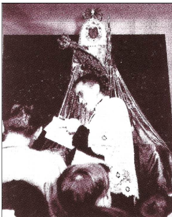
La iglesia parroquial de San Juan Bautista de Chío. A la derecha, albergando a la Virgen de Candelaria