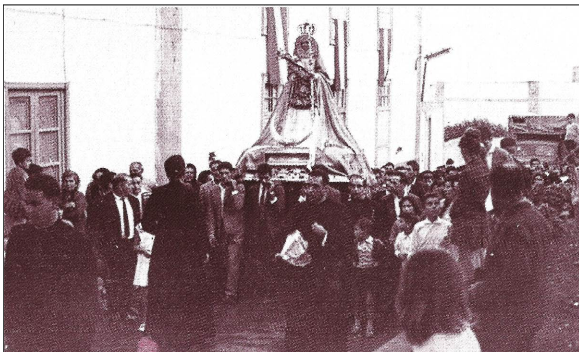
La Virgen de Candelaria en Guía de Isora. [Foto publicadas por Manolo Ramos (2009)].

Curiosamente, aunque en el “ Itinerario de la Peregrinación de la Santísima Virgen de la Candelaria ”, publicado en octubre de 1964 en la revista Radar Isleño , figuraba el domingo 1 de noviembre “ Procesiones a Tejina de Guía y a Playa de San Juan ”, desde Guía de Isora, en la crónica de la visita a este municipio publicada en Radar Isleño no se menciona la primera, aunque sí hemos visto que pasó por Playa de San Juan 9 .