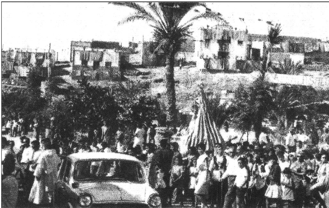
La Virgen de Candelaria en el Puerto de Alcalá, entre el vecindario.

Dos horas solamente permanecería la Santísima Virgen en Alcalá, muy poco tiempo, desde luego para lo que estos excelentes habitantes se hubieran merecido y hubiera sido su deseo; pero el suficiente para poder descubrir ese fenómeno de la profunda religiosidad de los isleños que en esta ocasión se puso al rojo vivo en el Puerto de Alcalá y que en nombre de todos los presentes pusieron a las plantas de la Señora los Capellanes, P. Isaías y P. Juan, en sendas pláticas. Durante la corta estancia de la Virgen las miles de gargantas no cesaron de entonar sus más férvidas y amorosas plegarias a la buena Madre nuestra y ofrecerle una comunión general que tras de la venerada Imagen de la Candelaria presidiría llena de santa alegría y emoción la Madre de los Cielos. 12