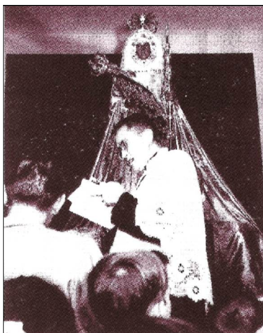
La iglesia parroquial de San Juan Bautista de Chío. A la derecha, albergando a la Virgen de Candelaria y el cura párroco don Juan Báez [Foto publicadas por Manolo Ramos (2009)].