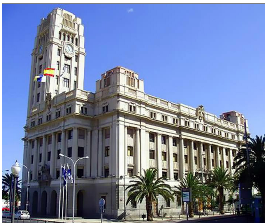
Cabildo insular de Tenerife.

Han pasado muchos años desde que en 1913 se constituyeron los Cabildos insulares, en su etapa moderna. En todo este tiempo, en el Cabildo de Tenerife se ha procurado que la representación de las distintas zonas de la isla fuese lo más equilibrada posible, simultaneándose consejeros del núcleo capitalino, con los del norte y del sur, e incluso alternándose en la presidencia y vicepresidencia según su procedencia.