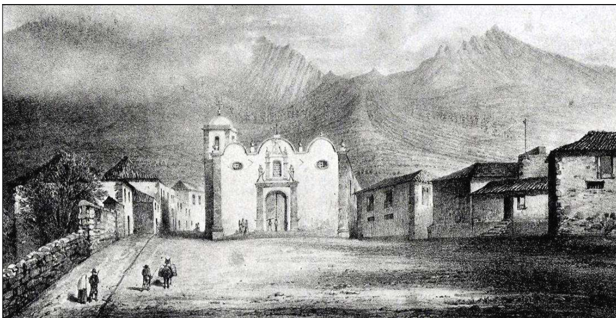
El Sr. Fernández del Castillo fue beneficiado propio de Güímar y Candelaria durante 12 años. Iglesia de Güímar [Grabado de Williams en las Misceláneas Canarias de Sabin Berthelot (1839)].