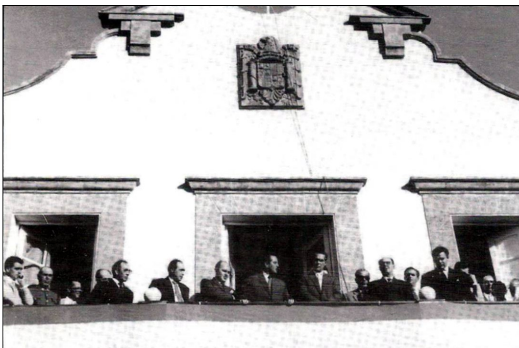
Inauguración de la casa consistorial de Fasnía, en 1961.