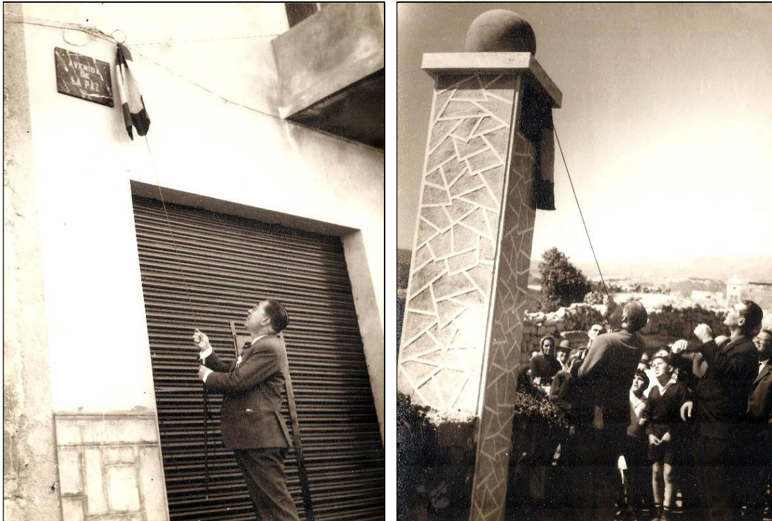
Inauguración y rotulación de las avenidas de la Paz y del Silencio, por don Juan Pablos Abril.

Ambos rótulos fueron descubiertos por el gobernador civil de la provincia, don Juan Pablos Abril, durante una de sus visitas a la localidad en la primavera de dicho año 1965.