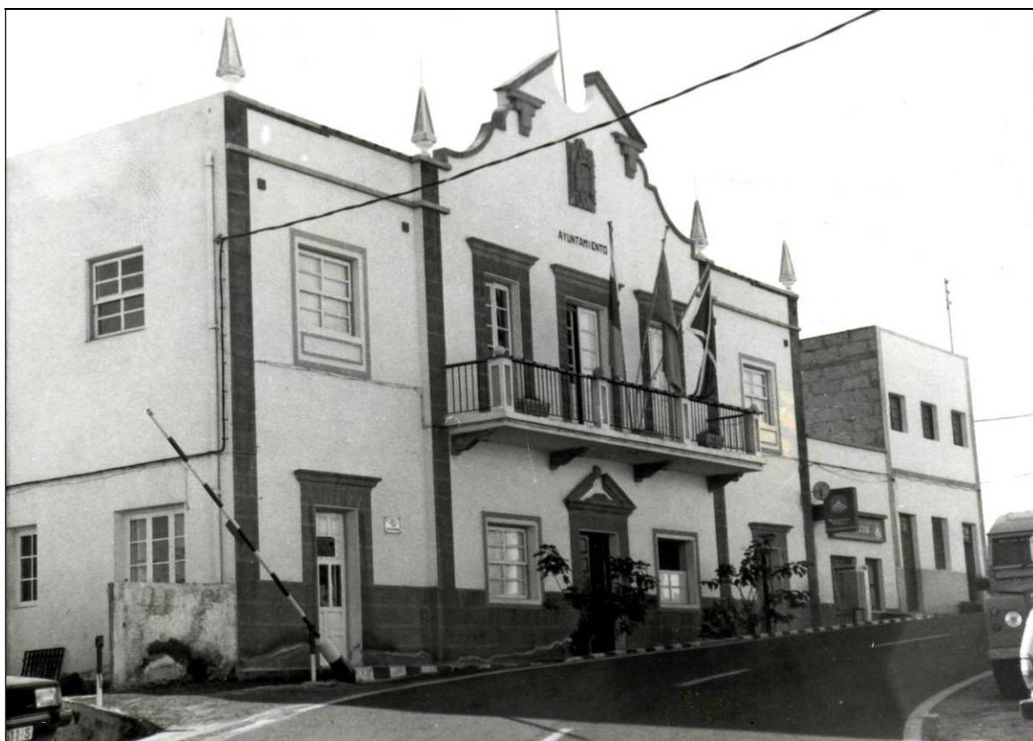
El Ayuntamiento de Fasnía concedió diversas distinciones entre 1939 y 1979.