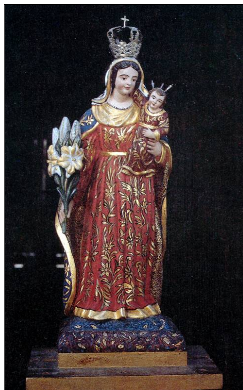
La Virgen de Abona, Patrona del Sur de Nivaria.