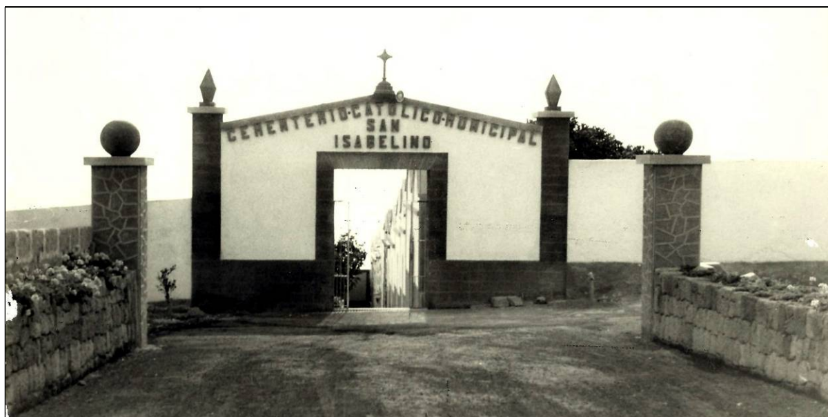
El cementerio “San Isabelino” de Fasnía.

La Corporación estimando justa y acertada la propuesta del Sr. Alcalde, la aprueba por unanimidad, acordando al mismo tiempo que se compren las letras para ser puestas en la fachada, quedando como sigue: “Cementerio Católico Municipal San Isabelino”.