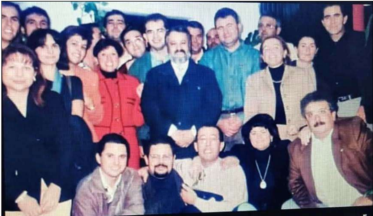
Reunión de la promoción 1977 del Instituto “Mencey Acaymo” de Güímar, en la cafetería del Mirador de Don Martín, en 1997.