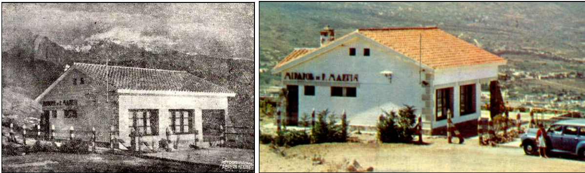
El Mirador de Don Martín, construido por el Cabildo en 1954, en su estado original.

Así surgió el primer mirador, que ya llevó el nombre de su promotor y que se limitaba a una pequeña explanada, con unos rústicos asientos de piedra.