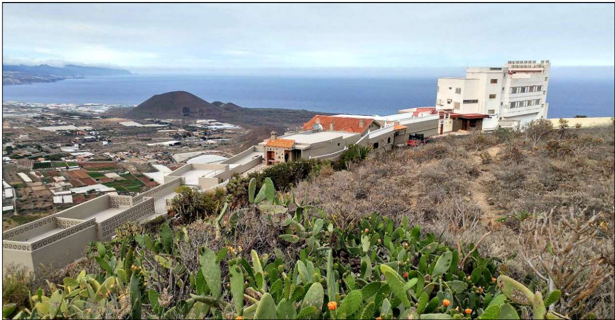
El Mirador en 2021, con su tejado a dos aguas, entre el Hotel y una vivienda particular, en la que hoy está integrado.

Pero con la entrada en funcionamiento de la Autopista del Sur el tránsito por la vieja Carretera General se redujo notablemente, al dejar de ser el lugar de paso obligado de antaño. Esta situación terminó obligando al cierre del Hotel y el anexo Mirador, tras el fallecimiento del dueño. Situación que se prolonga desde hace más de medio siglo. Posteriormente, dicho Mirador quedaría incluido en la vivienda particular de su propietario, anexa a dicho Hotel, como continúa hasta el presente.