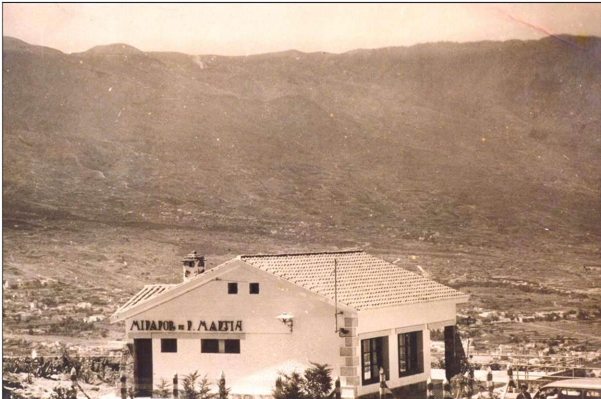
El Mirador de Don Martín, parada obligada de todos los que viajaban por la Carretera General del Sur.