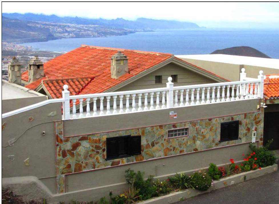
El Mirador de Don Martín, en la actualidad, incluido en una vivienda. [Foto de los hermanos Leandro].