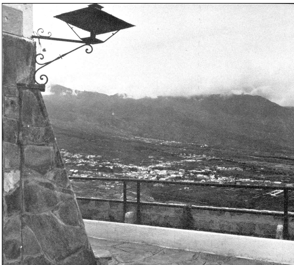
Parte de la vista panorámica del Valle de Güímar que se contemplaba desde el Mirador de Don Martín.