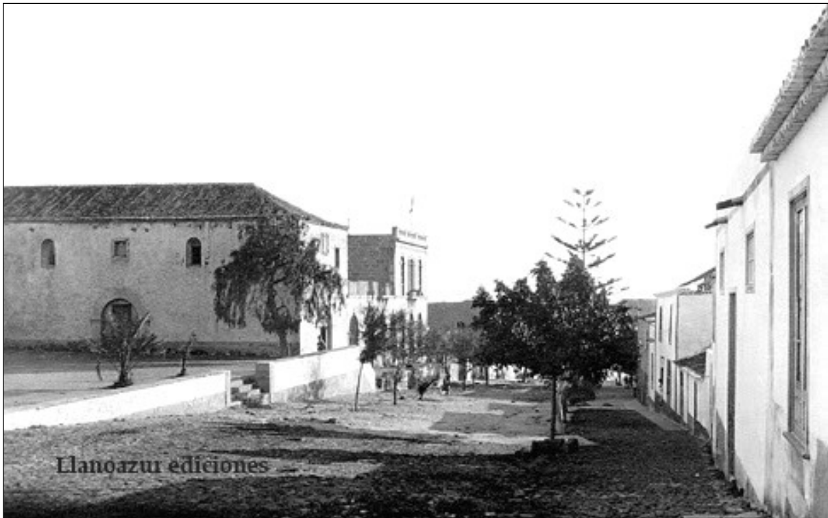
Plaza que, según la prensa, sustituyó a la calle prevista, en la nominación como “Fray Albino”.

En ese mismo año, se le tributó otro homenaje al obispo Fray Albino en San Cristóbal de La Laguna, donde se dio su nombre a la plaza de la Catedral y se le nombró Hijo Adoptivo de dicha ciudad. Asimismo se dio su nombre a otra calle de Granadilla de Abona, donde también se le nombró Hijo Adoptivo; y en San Miguel de Abona también se le puso su nombre a la calle en la que estaba la casa parroquial. Igualmente, Fasnia nombró Hijo