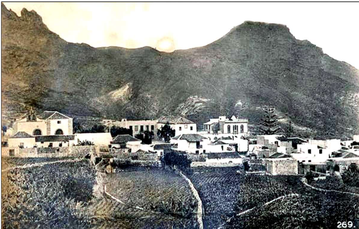
La villa de Adeje, con su iglesia matriz, la capilla del antiguo convento y el Ayuntamiento, en el que se acordó dar el nombre del obispo Fray Albino a la conocida hasta entonces como calle del Norte.

De desear es que el pueblo responda rápidamente a las gestiones que realiza dicha Comisión. 10