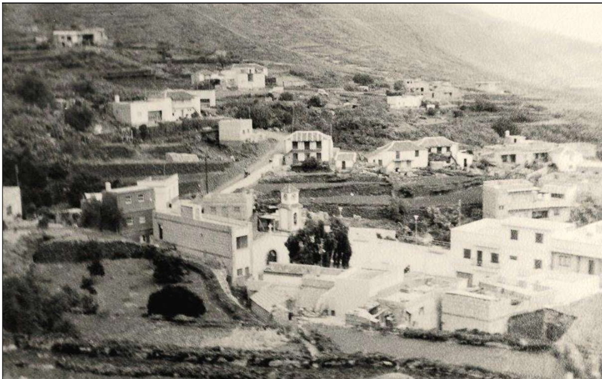
La Sociedad “C.D. Cárdenes” animó la vida deportiva y recreativa de Barranco Hondo, por lo menos desde 1943 hasta 1955.