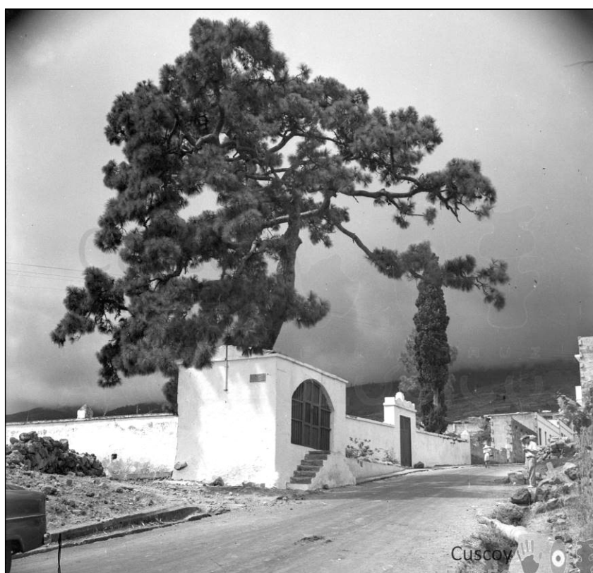
La Imagen de la Virgen fue recibida por el pueblo de Arafo en El Pino, junto al cementerio.