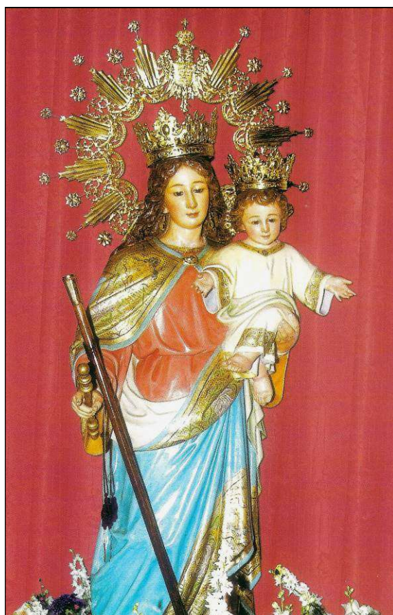
La bella imagen de María Auxiliadora, que llegó a Arafo en 1907. Hoy es Alcaldesa Honoraria y Perpetua de esta Villa y está coronada canónicamente.