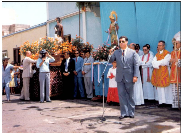
A la izquierda, coronación de la Virgen María Auxiliadora en 1957. A la derecha, acto de nombramiento de la Virgen como Alcaldesa Honoraria y Perpetua de Arafo en 1982.