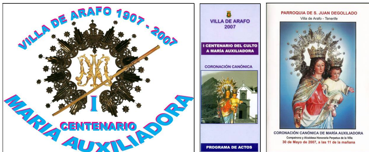
Anagrama y programas de los actos conmemorativos del I Centenario de María Auxiliadora y de su solemne Coronación Canónica.