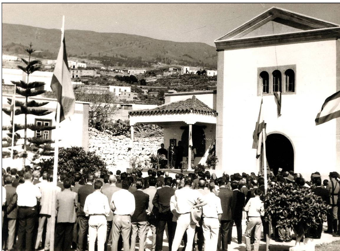
En 1960, el pueblo de Fasnía fue sacudido por un trágico suceso.