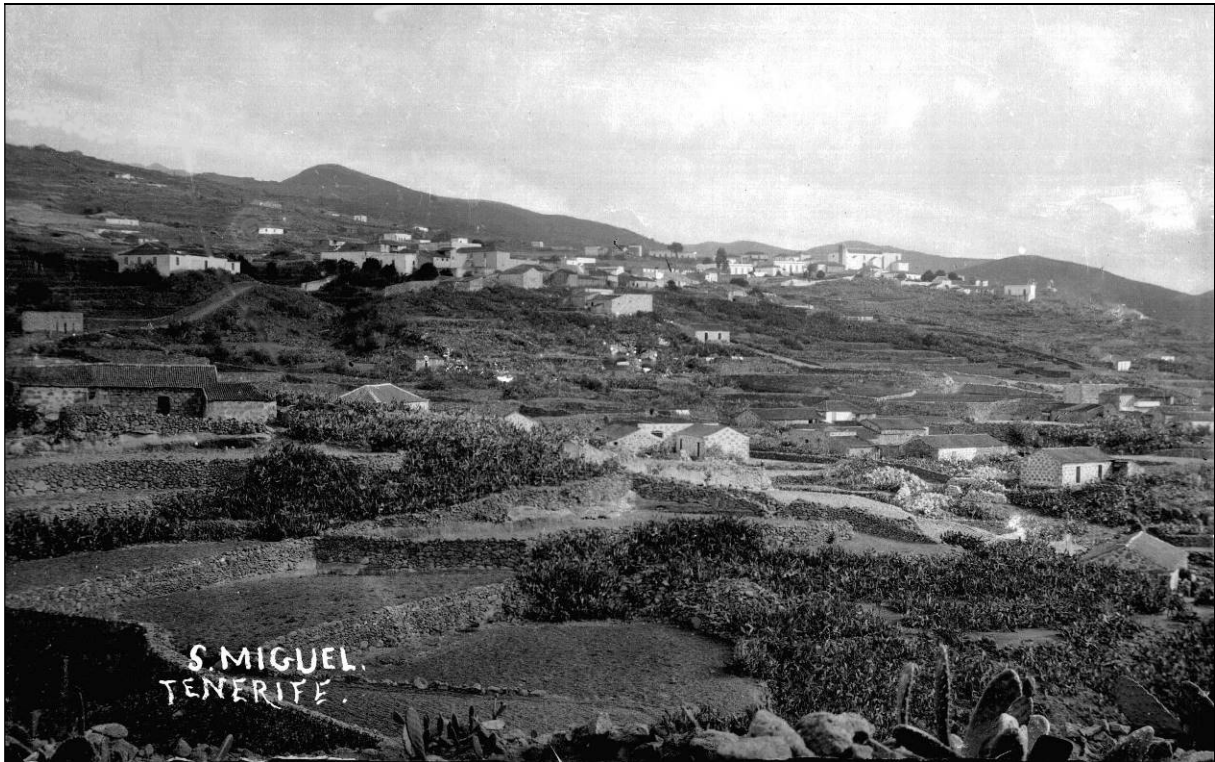
Vista panorámica de San Miguel de Abona, a finales del siglo XIX.

lamentablemente no había dinero para obras de nueva construcción ni otros gastos voluntarios. Por su parte, el presupuesto de ingresos para el mismo año sólo cubría 5.430 r s v n , procedentes de ingresos eventuales (impuestos extraordinarios). Por lo tanto, se preveía un déficit para dicho año 1861 de 1.227 r s v n , que se podría cubrir con 1.274 r s v n por recargos ordinarios sobre los cupos de las contribuciones. De este modo, hasta podrían sobrar 47 reales de vellón del presupuesto municipal. Como se aprecia, la situación económica comenzaba a ser angustiosa, lo que traería graves consecuencias en el futuro inmediato.