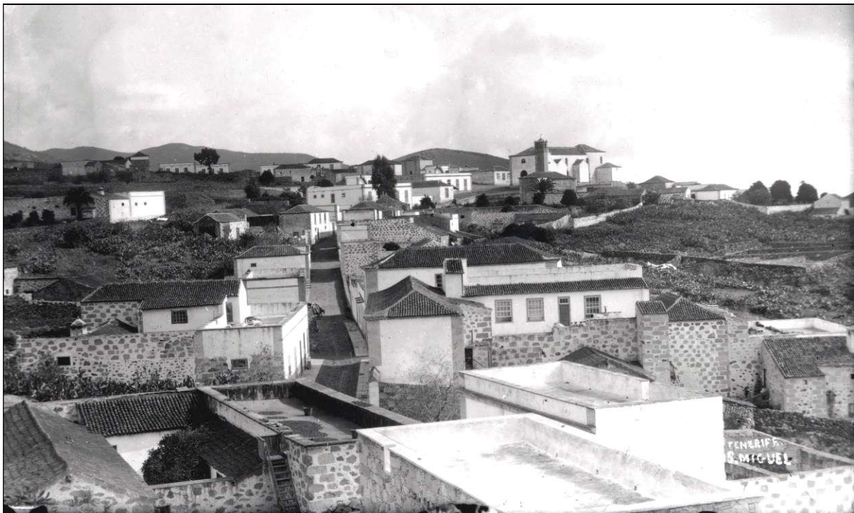
Vista parcial del casco histórico de San Miguel de Abona.

La participación de la población en la vida pública era escasa, si atendemos al número de electores, pues según la rectificación de listas de 1862 sólo le correspondían 16 electores por los mayores contribuyentes y otros 2 por capacidades, para las elecciones de diputados a Cortes y diputados provinciales, es decir, 1 elector por cada 106 habitantes. Mientras que para las elecciones municipales la representación aumentaba a 97 electores, 64 de ellos elegibles para las 12 plazas de concejales (uno por cada 19 habitantes); ello suponía que sólo un 5,06 % de la población podía elegir y sólo un 3,34 % podía ser elegido para los cargos municipales, ya que su condición de elector dependía de la cuantía de la contribución que pagaba, o sea, de su riqueza.