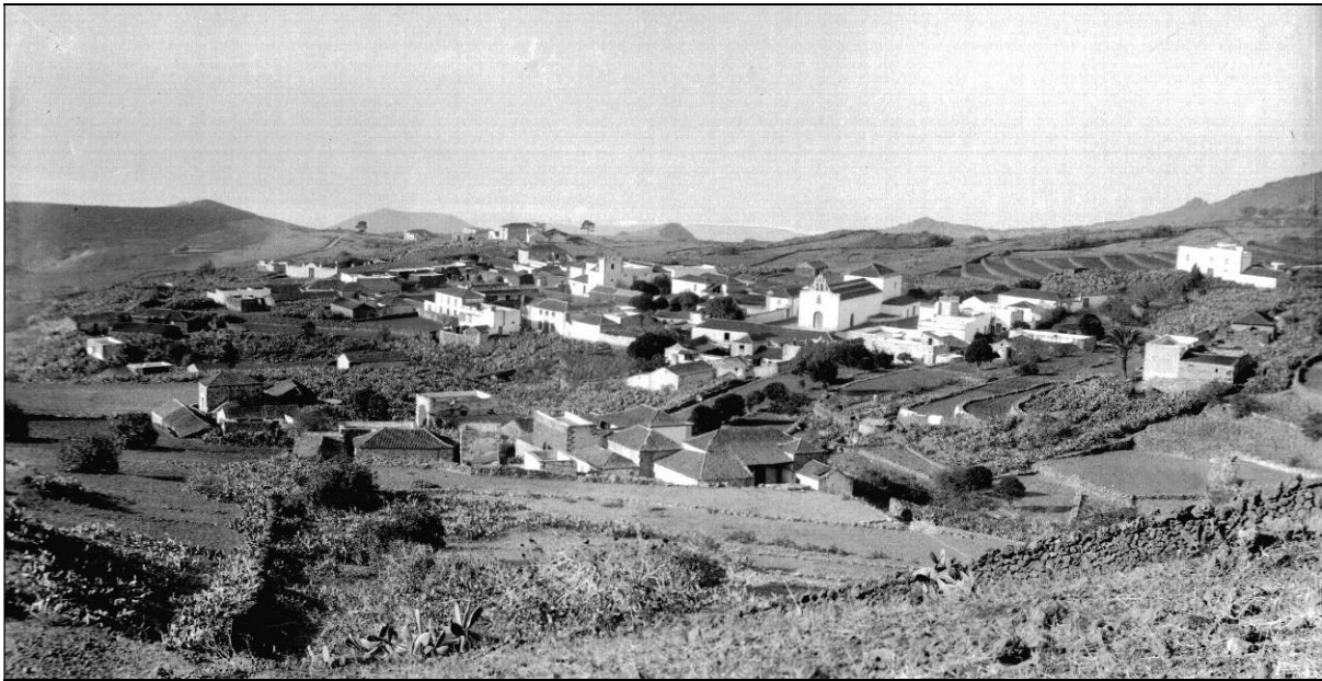
Don Agustín González Bethencourt fue uno de los principales promotores de la segregación religiosa y civil de Arona, así como alcalde de este pueblo en tres ocasiones.

anuales... pues ellos parece que creyeron que podían tener parroquia pero no mantenerla sino a expensas del cura 37 .