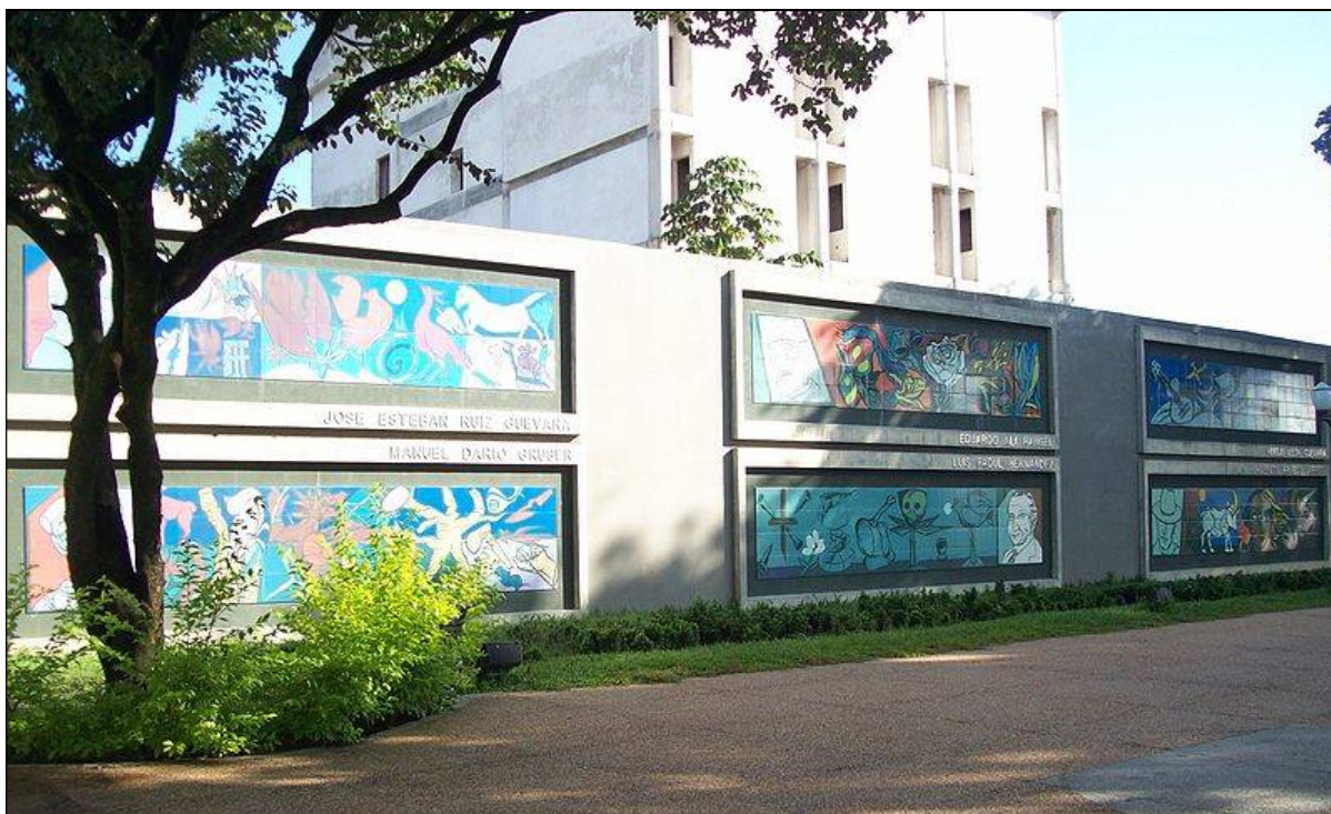
Plaza de los Poetas, en la ciudad de Barinas (Venezuela).