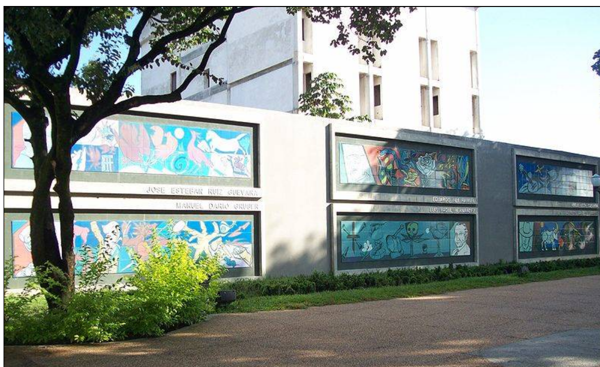
Plaza de los Poetas, en la ciudad de Barinas (Venezuela).

Asimismo, en la ciudad de Barinas intervino en diversas actividades culturales. Esta ciudad del occidente venezolano, capital del estado homónimo, se sitúa a orillas del río Santo Domingo y en el piedemonte andino, a unos 165 km de la ciudad de Mérida y 525 km de Caracas.