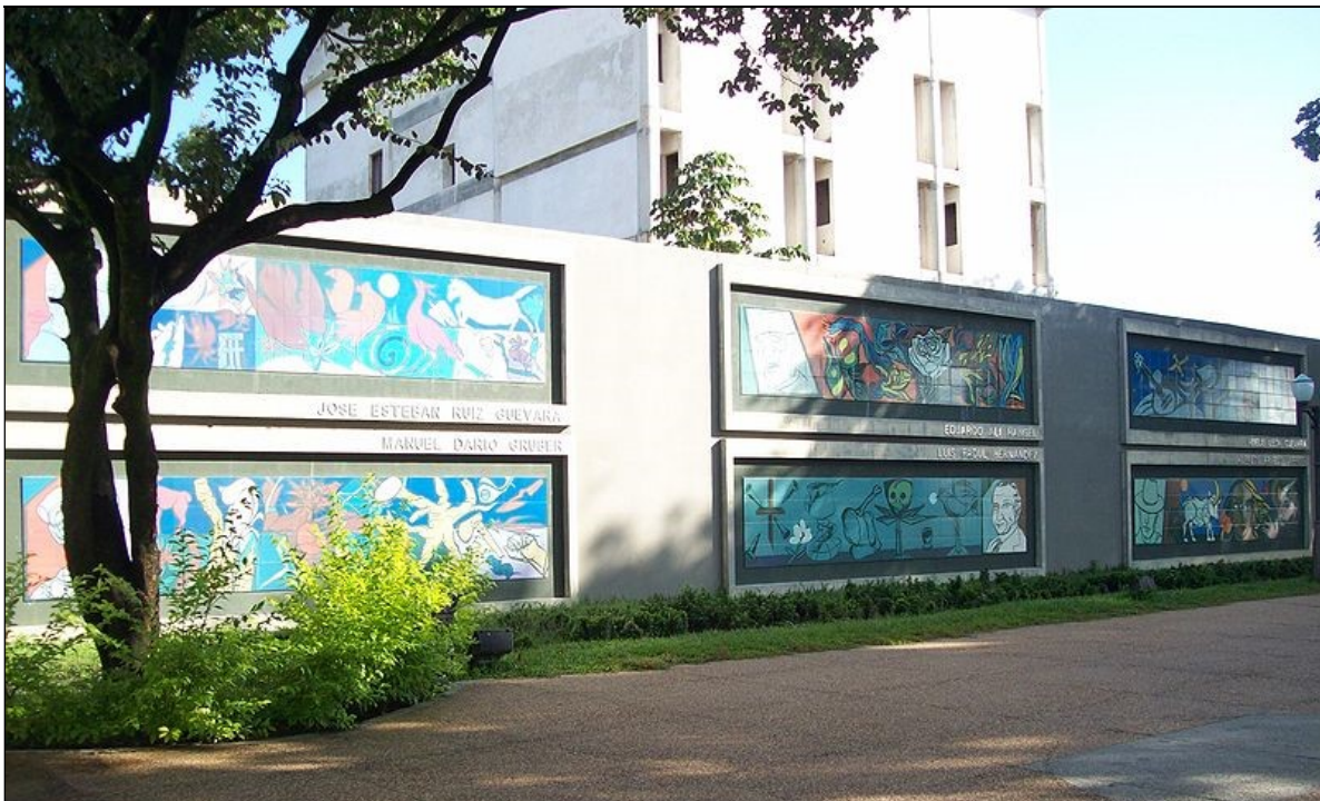
Plaza de los Poetas, en la ciudad de Barinas (Venezuela).

Asimismo, en la ciudad de Barinas intervino en diversas actividades culturales. Esta ciudad del occidente venezolano, capital del estado homónimo, se sitúa a orillas del río Santo Domingo y en el piedemonte andino, a unos 165 km de la ciudad de Mérida y 525 km de Caracas.