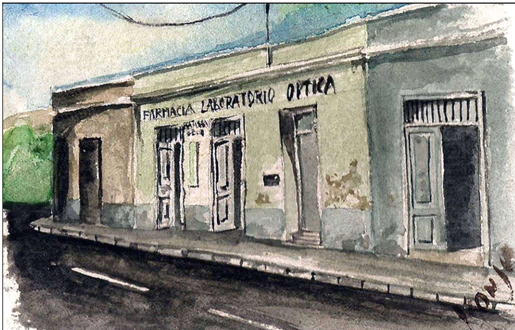
Antigua pintura con la fachada de la Farmacia Batista de Güímar.

En 1953 ya tenía prácticamente terminados sus estudios, por lo que se hizo la orla con sus compañeros de promoción de la Complutense, pero se le atravesaron dos asignaturas, que tuvo que cursar posteriormente en la Universidad de Granada, donde concluyó su carrera en febrero de 1955; y el 16 de marzo inmediato se le expidió en Madrid el título de Licenciada en Farmacia, siendo la primera güimarera que lo obtenía.