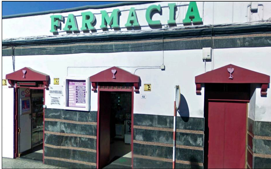
La farmacia Batista de Güímar en sus últimos tiempos.

Como curiosidad, en su larga andadura en la farmacia nuestra biografiada sufrió dos atracos, en uno de los cuales derribaron la puerta de entrada con un coche y se llevaron la caja fuerte, lo que obligó a blindar las puertas. Asimismo, sufrieron dos conatos de incendio, uno iniciado en la propia farmacia y otro en una tienda de tejidos situada en el edificio anexo, aunque sin producir mayores desgracias.