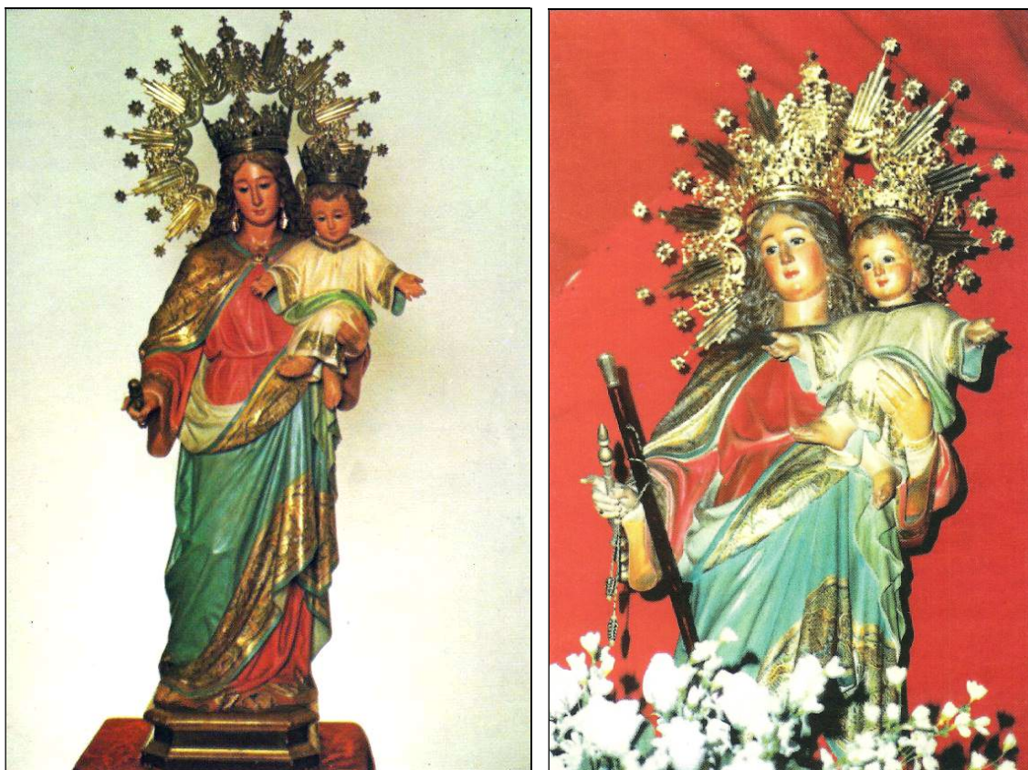
La bella imagen de María Auxiliadora, que llegó a Arafo en 1907. Hoy es Alcaldesa Honoraria y Perpetua de esta Villa y está coronada canónicamente.

Hoy la venerada imagen es Alcaldesa Honoraria y Perpetua de esta villa y está coronada canónicamente.