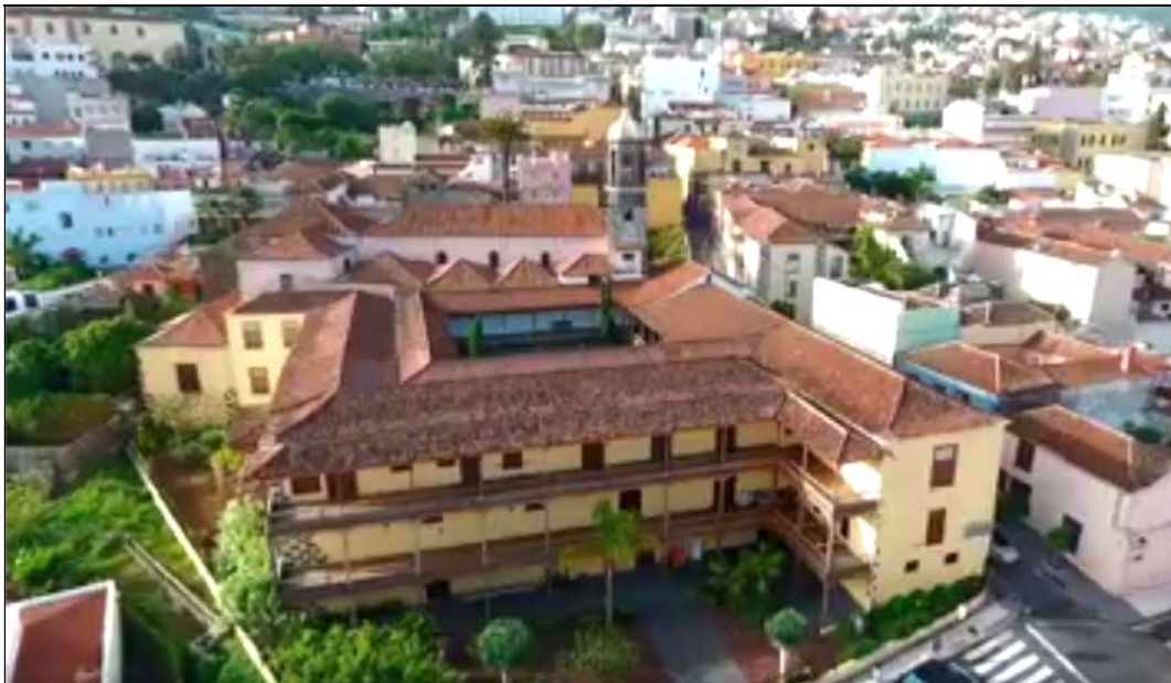
En primer plano, el Convento de San Benito de La Orotava, en el que fray Martín de la Cruz ejerció como lector de Artes y falleció.

En septiembre de 1788, fray Martín Juan de la Cruz regresó al Convento de Candelaria, en el que se aplicó a su cuidado y a celebrar el porcentaje de misas que se le asignaron dentro de la comunidad. Permaneció como morador en esta localidad hasta abril de 1790, en que se trasladó al convento de San Benito de la villa de La Orotava. 5