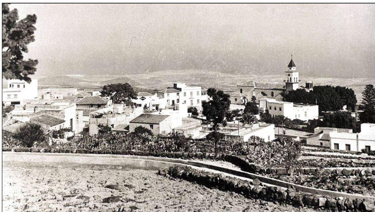
San Miguel de Abona.

Con anterioridad ya nos hemos ocupado en este mismo blog de otras numerosas descripciones de este municipio, publicadas en los siglos XIX y XX