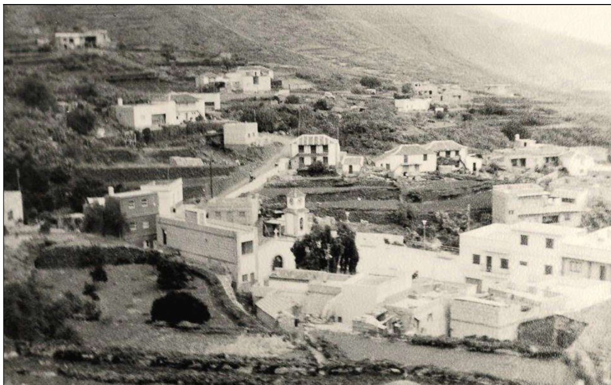
La Sociedad “C.D. Cárdenes” animó la vida deportiva y recreativa de Barranco Hondo, por lo menos desde 1943 hasta 1955.