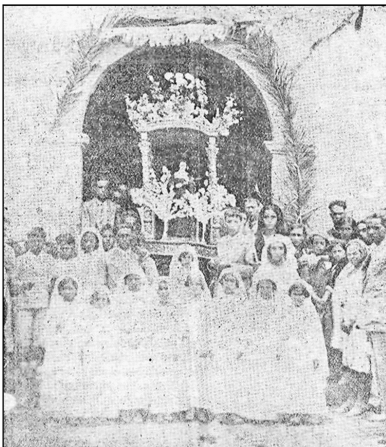
Niños de Primera Comuni3n en la fiesta en honor de Santa Rita, en Tamaimo. [Foto reproducida en Gaceta de Tenerife ].