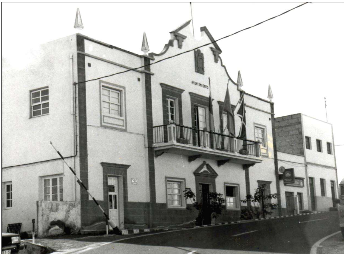
Antiguo Ayuntamiento de Fasnía, en el que se gestionó el expediente del Escudo municipal.

Este informe fue comunicado al Ayuntamiento de Fasnía por el director general de Administración Local del Ministerio de la Gobernación el 26 de marzo, a efectos del trámite de audiencia que le concedía el párrafo 11 del artículo 91 de la Ley de Procedimiento Administrativo, “significándole que esta Dirección General vería con complacencia que ese Ayuntamiento hiciera suyas las sugerencias expuestas por la Real Academia de la Historia en el transcrito dictamen y, en consecuencia, adaptara el diseño a la organización heráldica que dicha docta Corporación propone, a cuyo efecto se devuelve dicho diseño” .