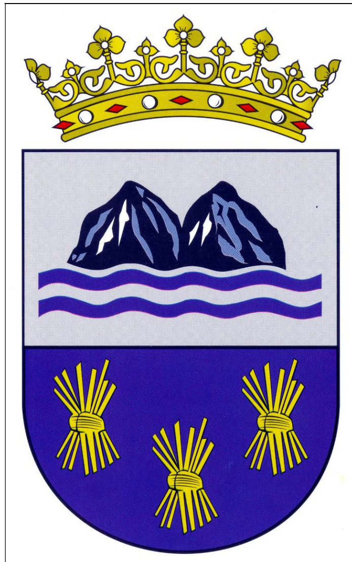
Escudo municipal de Fasnía, aprobado en 1968.

El Ayuntamiento quedó enterado de la aprobación del Escudo en la sesión plenaria celebrada el 6 de dicho mes de diciembre.