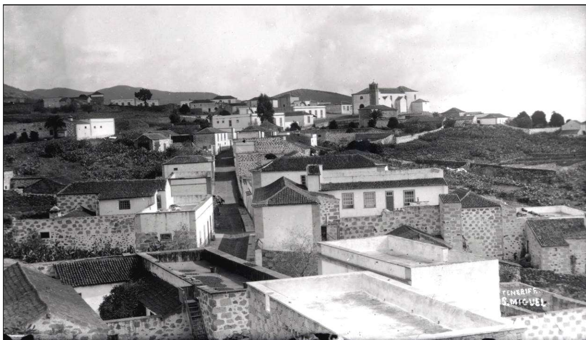
San Miguel de Abona a finales del siglo XIX.

Como curiosidad, el 11 de junio de 1920 llegó a Santa Cruz de Tenerife, junto a su familia, procedente del Sur de Tenerife 21 .