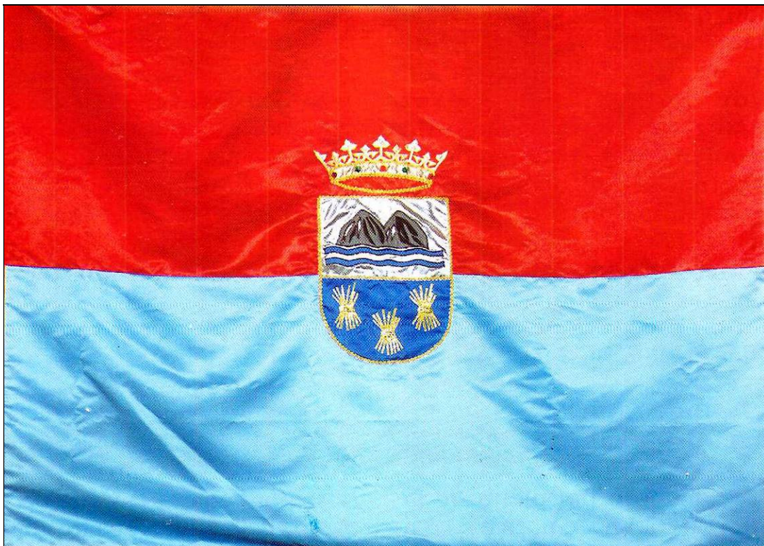
La Bandera municipal aprobada por el Ayuntamiento de Fasnía y el Gobierno de Canarias.

En el Boletín Oficial de la Provincia de Santa Cruz de Tenerife del 25 de febrero de dicho año 1998 y en el Boletín Oficial de Canarias del 31 de marzo inmediato, se insertó un anuncio relativo al período de información pública. Éste transcurrió sin que se presentasen alegaciones ni sugerencias al respecto, según se acreditó mediante certificación emitida por el secretario de la Corporación municipal.