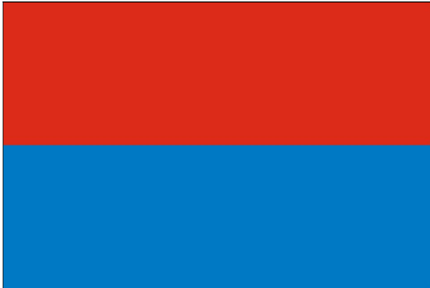
La Bandera municipal de Fasnia, sin escudo, diseñada por la Comisión de Heráldica de la Comunidad Autónoma de Canarias.

Una vez recibido dicho acuerdo, por providencia del alcalde de Fasnia del 12 de febrero de 1998 se incoó por este Ayuntamiento el procedimiento para la aprobación de la mencionada Bandera municipal proyectada. En cumplimiento de la misma, se solicitó el preceptivo informe jurídico a la secretaria-interventora de la corporación municipal, quien lo emitió en esa misma fecha. Luego, el 17 de ese mismo mes, se emitió el informe-dictamen favorable por la Comisión Municipal Informativa de Organización, Territorio, Población y Defensa.