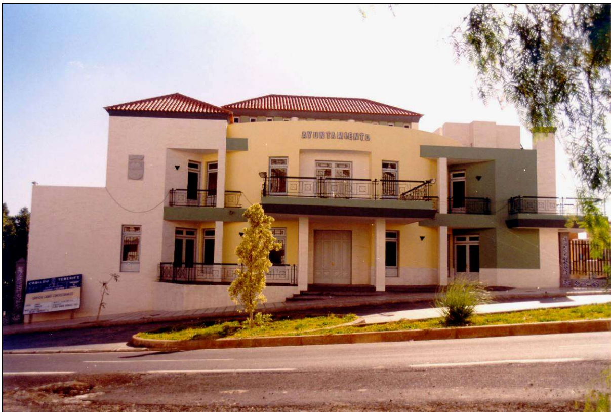
La actual casa consistorial de Fasnia, que en su inauguración ya lució la Bandera municipal.