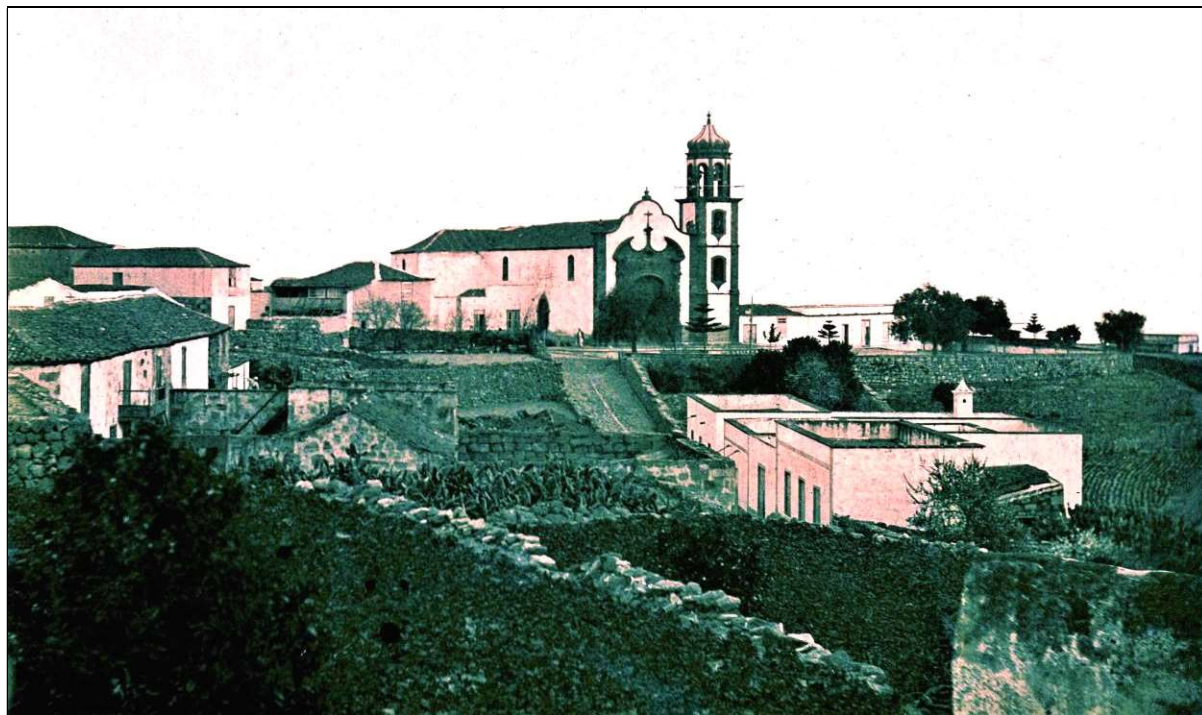
La Villa de Arico, que en 1924 inauguró su estación telefónica.

Por fin, en 1924 llegó la red telefónica al amplio término municipal de Arico, lo que permitió que en dicho año se abriesen estaciones telefónicas en los principales núcleos de población: El Lomo o Villa de Arico, El Río, Arico el Nuevo, Porís de Abona y Tajao. Asimismo, en ese mismo año se instalaron locutorios telefónicos en los núcleos más pequeños: La Degollada, La Sabinita e Icor; luego, en 1931, se concedió otro a La Cisnera. En este artículo solo nos vamos a centrar en la primera de dichas estaciones, la de la villa capital y en las primeras telefonistas que trabajaron en ella.