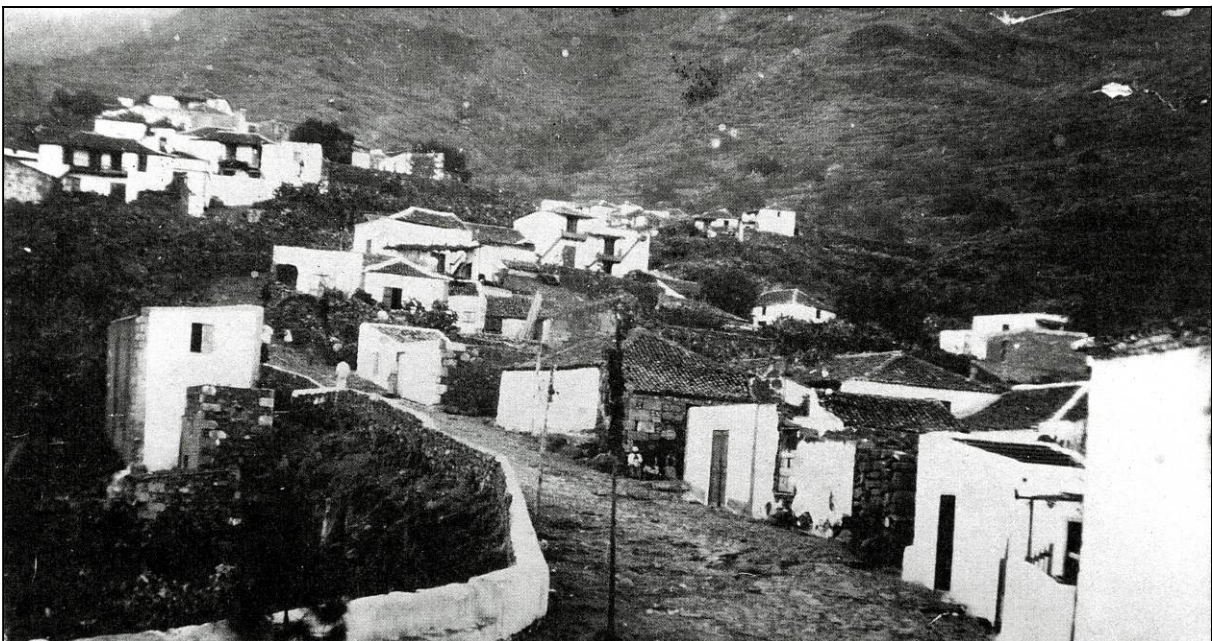
Iguste contó con una orquesta de cuerda por lo menos desde 1932. [Fotograbado Cabrera Benítez].

En la primera mitad del siglo XX fueron varios los grupos u orquestas de cuerda que surgieron en Iguste para alegrar el pueblo por las fiestas y amenizar bailes, tanto en esta localidad como en otros pueblos de la comarca. Actuaban en las plazas, así como en casinos y salones particulares, alegrando la vida de nuestros antepasados, que por entonces no era precisamente fácil. En ocasiones estaban constituidas por tan solo dos miembros e incluso, en más de una ocasión, un único músico llegó a animar un baile.