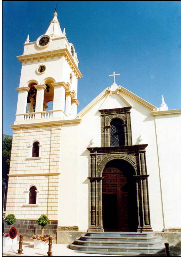
En cuatro ocasiones, la Virgen del Socorro ha visitado la iglesia parroquial de San Juan Degollado de Arafo.

Era la primera vez en la historia que la Virgen del Socorro visitaba el municipio de Arafo, en el que tanta veneración se le tenía. También fue la primera ocasión en la que visitó Fasnia, así como los distintos pueblos de la comarca güimarrera de Agache.