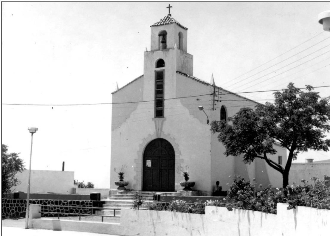
Tras su entrada en el municipio de Arafo, procedente de Güímar, la Virgen del Socorro visitó En 1988 la ermita, hoy iglesia, de Ntra. Sra. del Carmen.

Queremos, por último, colaborar con el proyecto de nuestro Obispo de, como monumento de amor de este Año Mariano, que se erija una casa de acogida para todos aquellos enfermos que, por distintas circunstancias necesitan de nuestra asistencia en el momento difícil de la convalecencia de sus enfermedades. Nuestra ayuda económica vendrá a ser una piedra más en ese hogar y un gesto perenne de abrazo a estos hermanos que sufren. 6