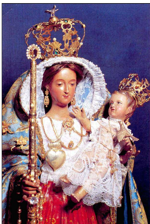
La Virgen del Socorro, profundamente venerada por los vecinos de Arafo.

Diversas han sido las visitas de imágenes de distintas advocaciones de la Virgen que, procedentes de otras localidades, por diferentes motivos se han acercado hasta la villa de Arafo. Algunas de ellas gozan en este municipio de una profunda veneración, sobre todo la Virgen del Socorro de la vecina ciudad de Güímar, imagen que ha visitado esta villa en cuatro ocasiones.