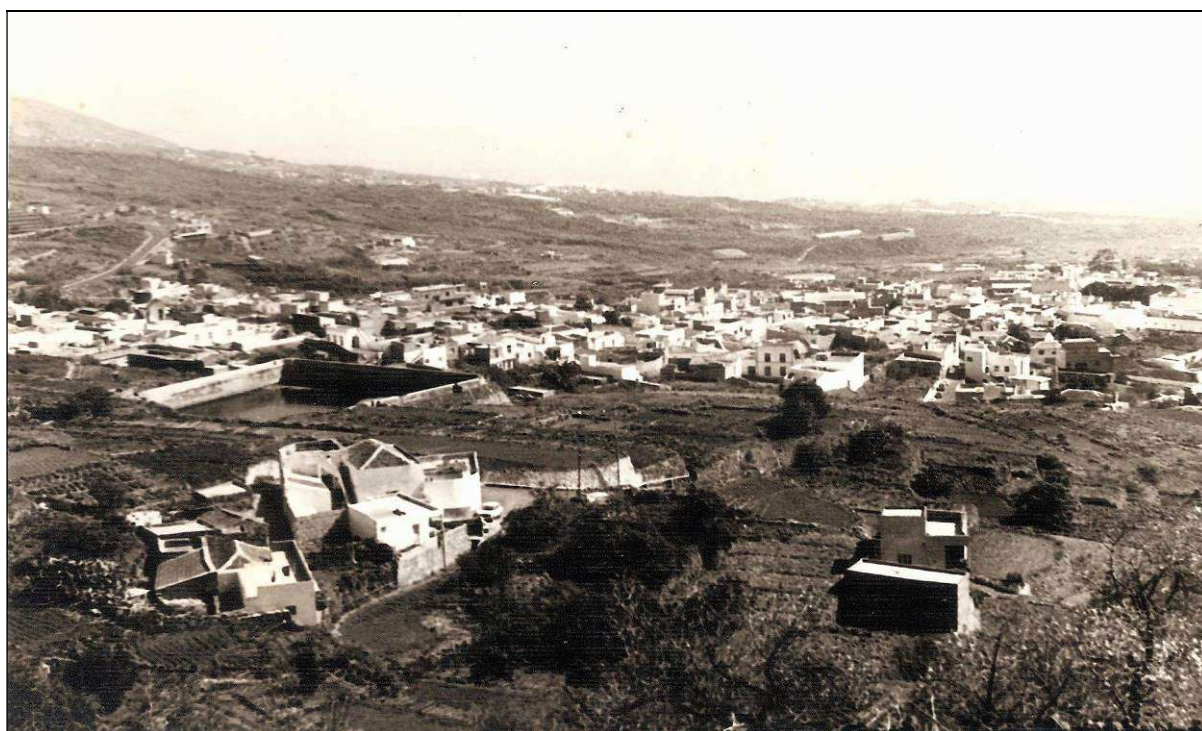
En 1965, Arafo figuró en la Guía de la Diócesis de Tenerife y recibió una Santa Misión.

Contamos con una somera descripción del municipio de Arafo en 1965, centrada sobre todo en su dotación parroquial y en la religiosidad de su feligresía, gracias a dos destacados acontecimientos: la publicación del libro Guía de la Diócesis de Tenerife del canónigo don José Trujillo Cabrera, en el que se recogían interesantes datos de la única parroquia existente por entonces en esta localidad; y la celebración de una Santa Misión 2 , que tuvo su sede en la cabecera municipal.