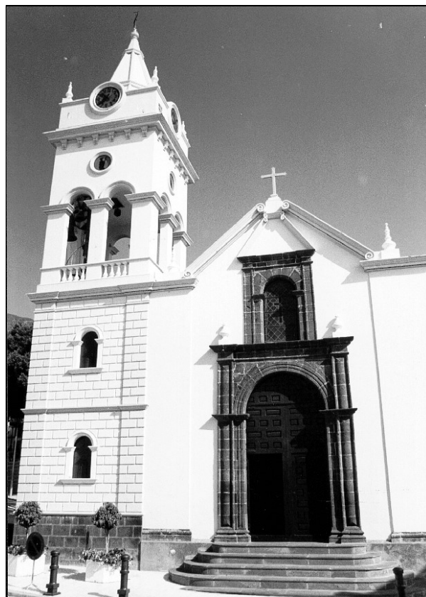
La iglesia de San Juan Degollado de la villa de Arafo, sede de la única parroquia existente en el municipio en 1965.