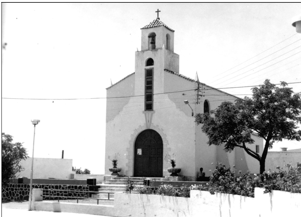
La entonces ermita de Ntra. Sra. del Carmen, una de las sedes de la Santa Misión.

En conjunto podemos catalogar esta misión, como de extraordinaria, pues el fin principal que es la predicación masiva de la palabra de Dios se logró, pues llegó a todos. 10