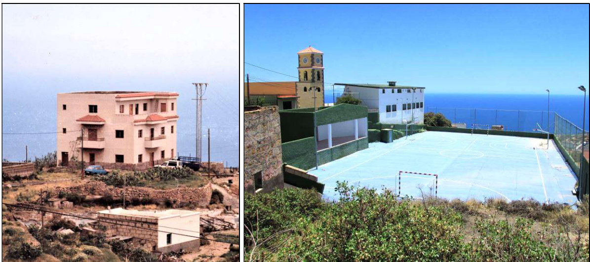
El Centro Cultural y el polideportivo de Lomo de Mena.

Lo que sí se ha conseguido, es la construcción por el Ayuntamiento de un polideportivo en La Hoya, el cual, además de para la práctica de diversas actividades deportivas, también se utiliza en las fiestas, para aquellos actos en los que la asistencia de público desborda la plaza del barrio.