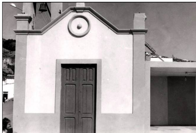
A la izquierda, la Casa de los Mena, que dio nombre al pueblo. A la derecha, la antigua ermita de La Santa Cruz.