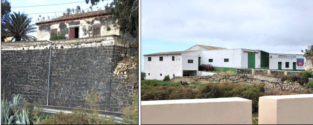
A la izquierda, la bella “Caseta de los Camineros”, en estado ruinoso. A la derecha, la Cooperativa Agrícola “El Calvario”.

locutorio telefónico en una casa particular; éste y el de la cooperativa fueron los únicos teléfonos con que contaba el barrio hasta que, a principios de los ochenta, se permitió la conexión a todos los vecinos, en las mismas condiciones que el resto de los barrios del municipio. A mediados de esta última década se instaló en la subida del Calvario una cabina telefónica, con lo que se cumplía un sentido deseo vecinal.