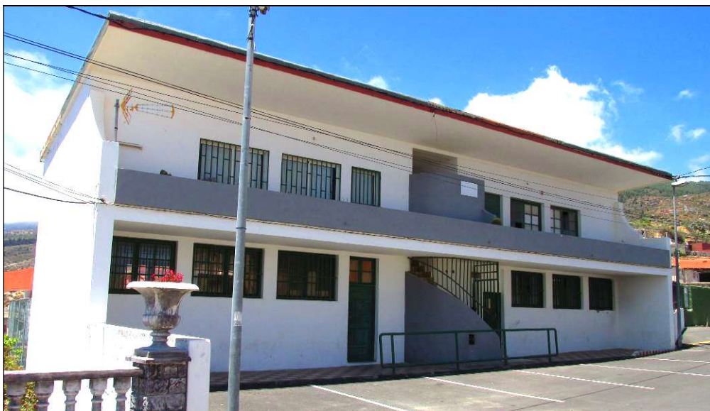
La antigua agrupación escolar de Lomo de Mena, que estuvo en funcionamiento desde 1960 hasta 1998.