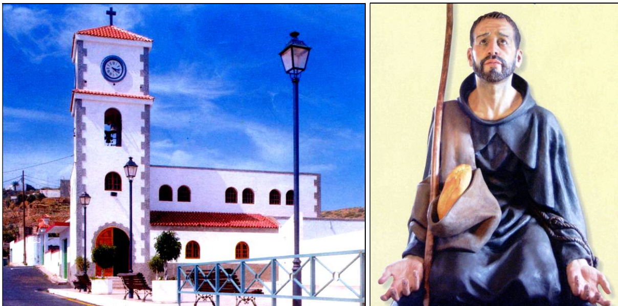
La actual iglesia parroquial de La Santa Cruz de Lomo de Mena y la bella imagen del Hermano Pedro que se venera en su interior.