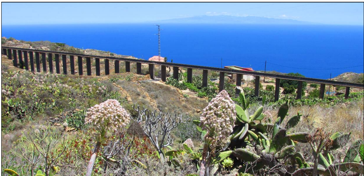
El conocido acueducto del “canal de Güímar” a su paso por Lomo de Mena.