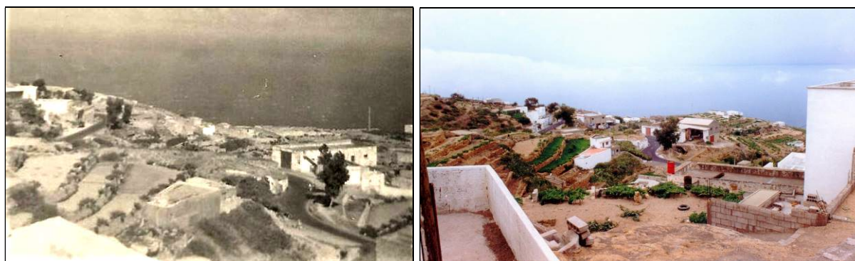
Antiguas vistas parciales de Lomo de Mena.