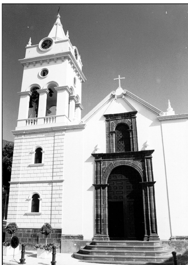
La iglesia de San Juan Degollado de la villa de Arafo, sede de la única parroquia existente en el municipio en 1965.