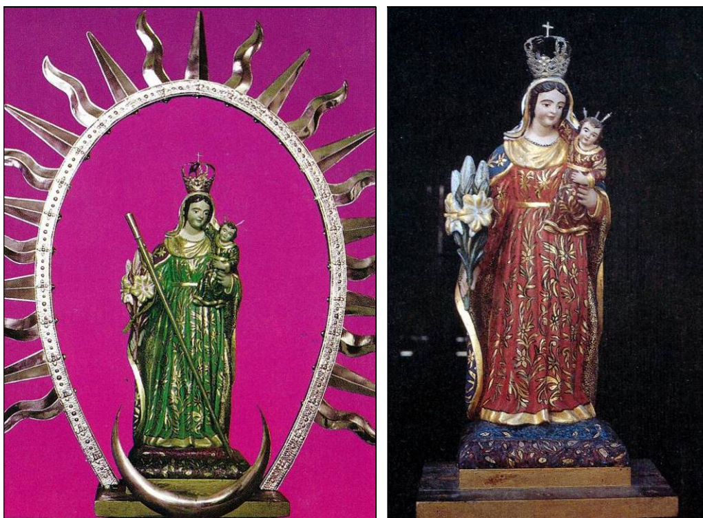
La Virgen de Abona, Patrona del Sur de Nivaria.

La Virgen de Abona es una pequeña imagen del siglo XVIII, que se veneraba en el santuario de la Punta de Abona (Arico), a donde acudían anualmente muchos peregrinos, hasta la destrucción de dicho templo en un grave incendio. Por dicho motivo se instaló en la iglesia parroquial matriz de San Juan Bautista de la villa de Arico 12 , de la que es compatrona, y sus fiestas se celebran en el mes de septiembre. En 1961 fue nombrada alcaldesa honoraria y perpetua de Arico, así como patrona del Sur de Tenerife. A partir del año 1966 se celebra una Bajada de la Virgen cada cinco años desde la Villa de Arico hasta el núcleo costero de la Punta de Abona.