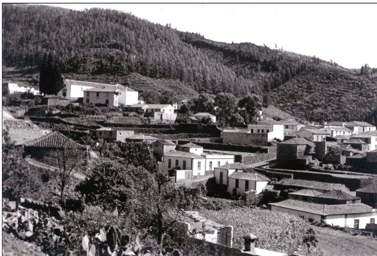
Vista parcial de la cabecera municipal de Vilaflor de Chasna.

Aunque el Ayuntamiento de Vilaflor de Chasna nunca ha sido muy pródigo en la concesión de honores y distinciones, durante la Dictadura franquista se aprobaron muchas más que en toda la historia municipal anterior. A pesar de que tras el golpe de estado que inició la Guerra Civil se acordó mantener los nombres tradicionales de las calles y las plazas del municipio, en las décadas posteriores se concedieron por lo menos diez distinciones para siete personas y una imagen religiosa, siendo probable que aún falte alguna que por el momento no hayamos podido localizar: en 1936 se nombró Hijo Adoptivo al general don Francisco Franco Bahamonde; en 1943 se concedió la misma distinción al secretario del Ayuntamiento don Manuel Fernández López; en 1947 se nombró Hijo Adoptivo el nuevo obispo tinerfeño don Domingo Pérez Cáceres y se dio su nombre a la plaza principal de la localidad; pocos años después se nominó una calle con el nombre del ingeniero forestal don Francisco Ortuño Medina; en 1961 se nombró Hijo Predilecto al Hermano Pedro, cuyo nombre también se dio a una avenida; en ese mismo año se nombró Alcaldesa Perpetua a la Virgen de Abona, Patrona del Sur de Nivaria; y en 1962 se concedió el título de Cronista Oficial de Vilaflor, primero al abogado don Jesús Hernández Acosta y luego al maestro y poeta don Emeterio Gutiérrez Albelo, probablemente por renuncia del anterior.