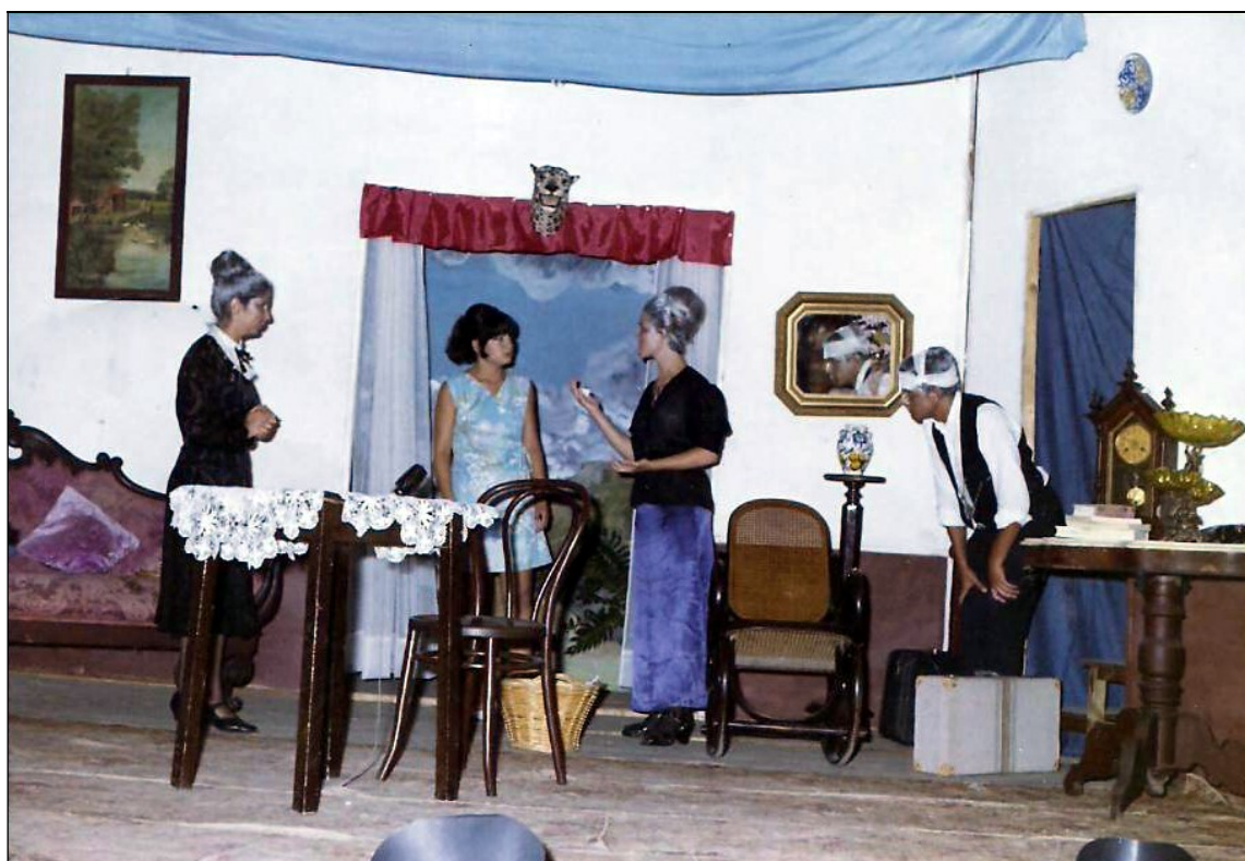
Interpretación de “ La Tercera Palabra ”, en 1969.

Pero en este trabajo vamos a centrarnos en uno de los grupos de aficionados que mantuvo una trayectoria más dilatada y exitosa, el Grupo de Teatro “La Juventud”.