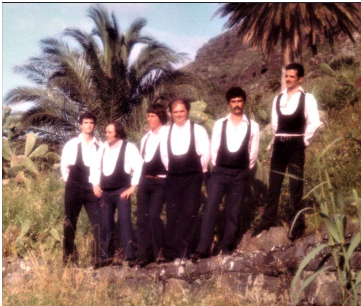
Otra imagen de la orquesta “Power” de Arafo.

orquesta de Tenerife «Power», de Arafo, formada por siete profesores de música y su vocalista, acompañado con instrumentos de aire (saxofón, trompeta, etc.)” 1 .