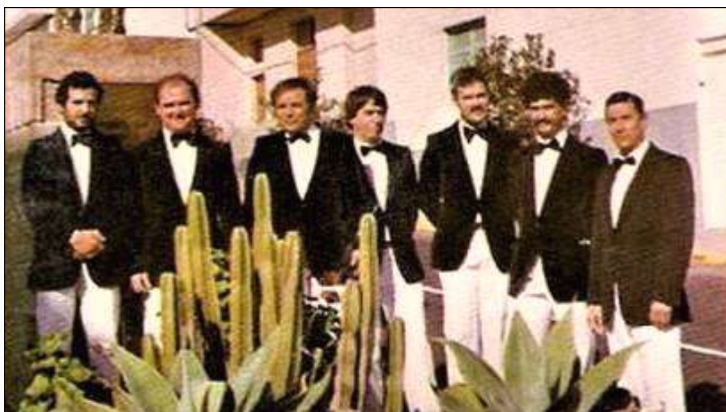
La orquesta “Power” de Arafo.

Una de las numerosas orquestas de baile fundadas en Arafo en el pasado siglo XX fue la orquesta “Power”, que recorrió los escenarios de Canarias en los años ochenta. Llevaba el mismo nombre que habían tenido otras agrupaciones musicales de las islas: una orquesta “Power” de Santa Cruz, en 1912; otra orquesta “Filarmónica Power”, también en la capital tinerfeña, en 1923; una orquesta u orquestina “Power” de La Orotava, compuesta por varios miembros de la banda municipal de dicha villa y dirigida por el destacado músico Domingo Febles, en 1931-1935; una orquestina “Power” de Santa Cruz de Tenerife, en 1936; otra orquestina “Power” de Teror, en 1935-1936; y la más longeva, una popular orquesta “Power” de El Paso, que formaba parte de la Agrupación Musical Vives, en 1940-1969.