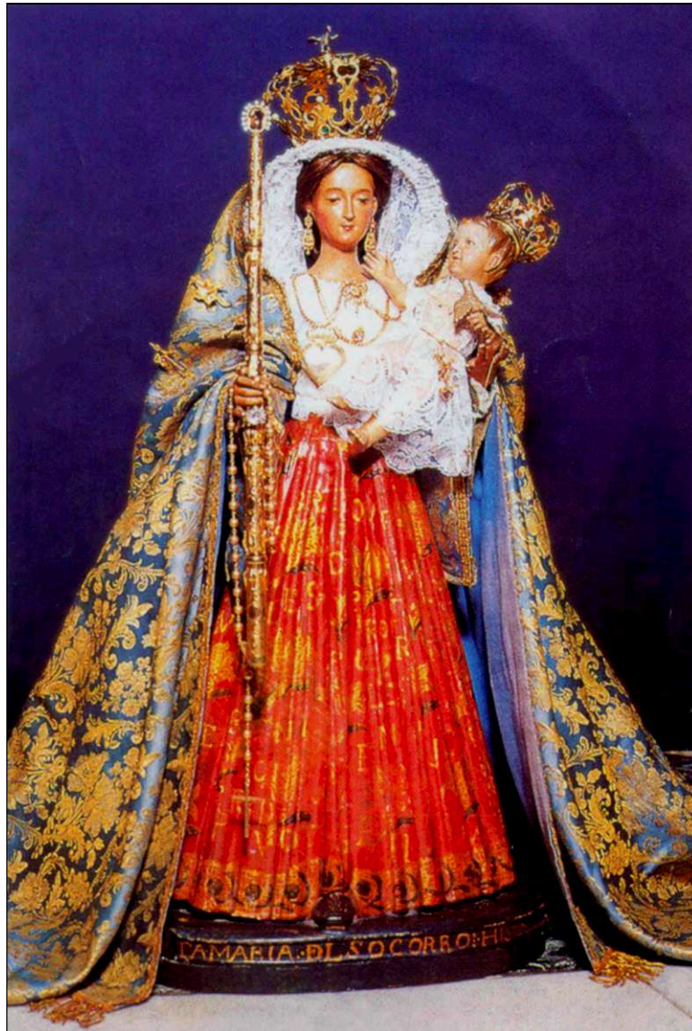
La Virgen del Socorro, que desde 1837 celebra su festividad el 8 de septiembre.

coyuntura especialmente favorable. Tras conseguir el cambio solicitado, la Virgen del Socorro acaparó la mayor atención de los devotos tinerfeños durante gran parte del siglo XIX, hasta que la Virgen de Candelaria recuperó su antiguo esplendor, gracias a la confirmación de su Patronazgo sobre las dos Diócesis de Canarias en 1867 y a su Coronación Canónica en 1889. Pero ello no impidió que las fiestas en honor de Nuestra Señora del Socorro, en Güímar, se consolidasen y hayan continuado manteniendo una creciente afluencia de romeros hasta el presente.