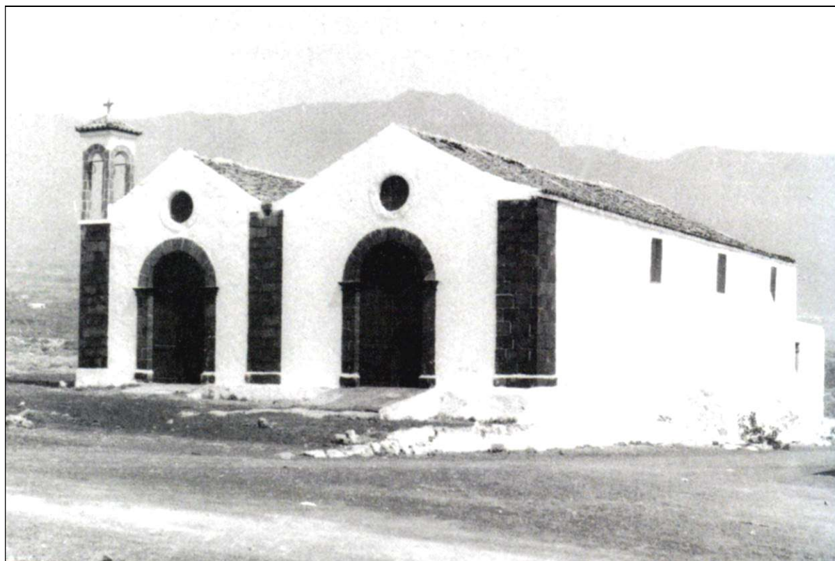
En 1837, se cambió oficialmente para septiembre la festividad de la Virgen en la ermita de El Socorro.

Al crearse la Cofradía de Nuestra Señora del Socorro en 1643, se institucionalizó la fiesta anual de esta advocación de la Virgen, como patrona de “ las sementeras ”, para el día 18 de diciembre de cada año, en cuya fecha se celebró en adelante hasta bien entrado el siglo XVIII. Pero a comienzos del siglo XIX dicha festividad ya había cambiado de día, pues la función anual se celebraba “ con numerosa concurrencia el día 2º de Pascua de Navidad ”, es decir, el 26 de diciembre, fecha en la que se celebró hasta 1835. Pero las lluvias invernales dificultaron la celebración de la fiesta en muchas ocasiones, obligando a retrasarla para los meses siguientes.