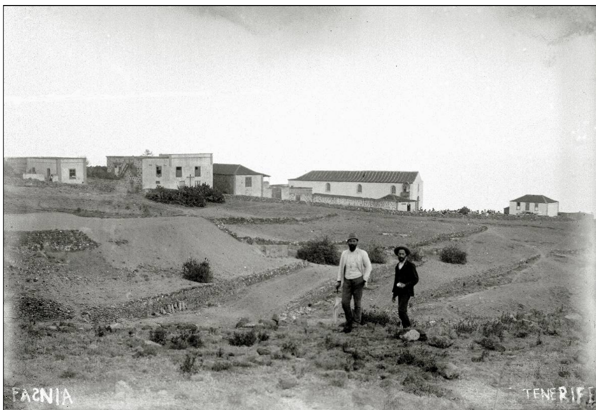
Fasnia, a finales del siglo XIX.

Por su parte, en 1859 el ganado se elevaba a 2.868 cabezas: 1.180 ovejas (41,14 %), 1.070 cabras (37,3 %), 310 cerdos (10,8 %), 147 asnos (5,12 %), 120 mulos (4,18 %), 39 vacas (1,36 %) y 2 caballos. 4