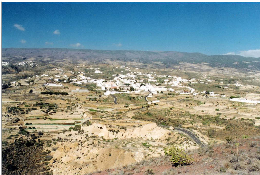
Vista parcial del término municipal desde la Montaña de Fasnía.

elector por los mayores contribuyentes para las elecciones de diputados a Cortes y diputados provinciales. Mientras que para las elecciones municipales la representación aumentaba a 90 electores, 60 de ellos elegibles para las 8 plazas de concejales (uno por cada 20 habitantes); ello suponía que sólo un 4,95 % de la población podía elegir y sólo un 3,3 % podía ser elegido para los cargos municipales, ya que su condición de elector dependía de la cuantía de la contribución que pagaba. 10