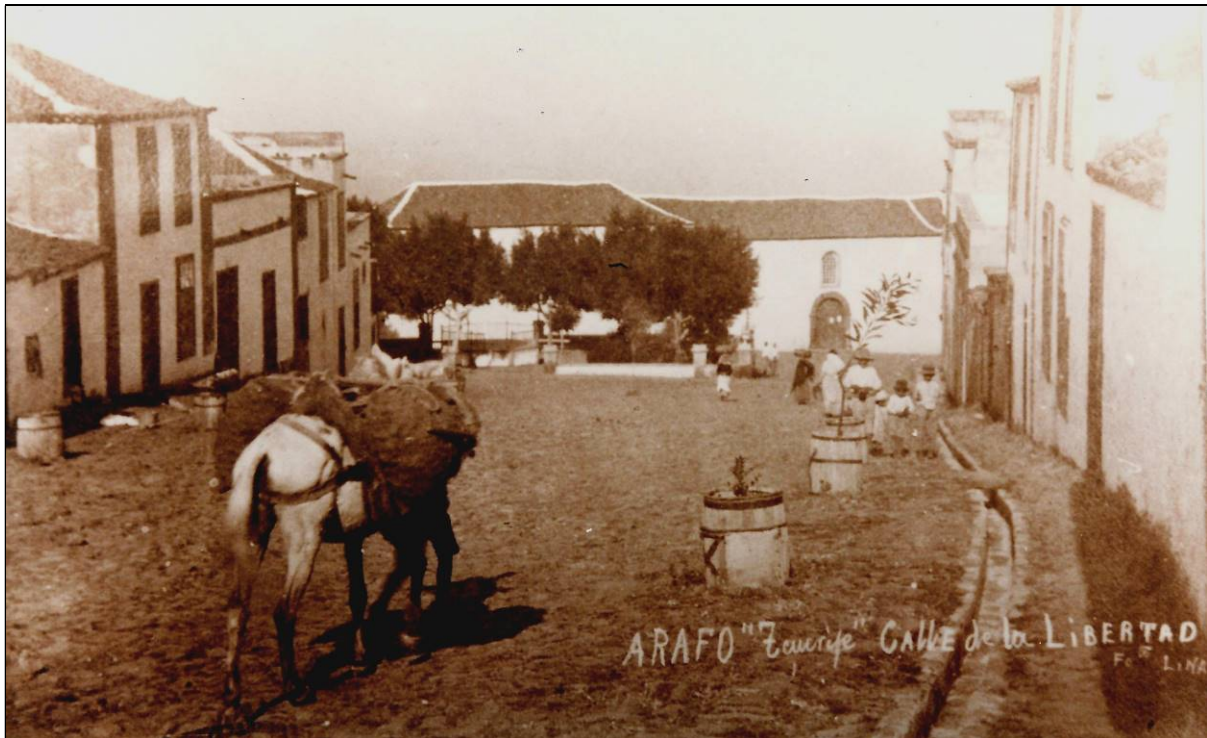
El capitán don Juan de Torres Marrero probablemente tuvo mucho que ver en la reconstrucción del pueblo de Arafo tras su destrucción parcial en la erupción volcánica de 1706.

En 1707, el citado Tercio de Milicias de Güímar se transformó en el Regimiento del mismo nombre, en el que don Juan continuó prestando sus servicios el resto de su vida.