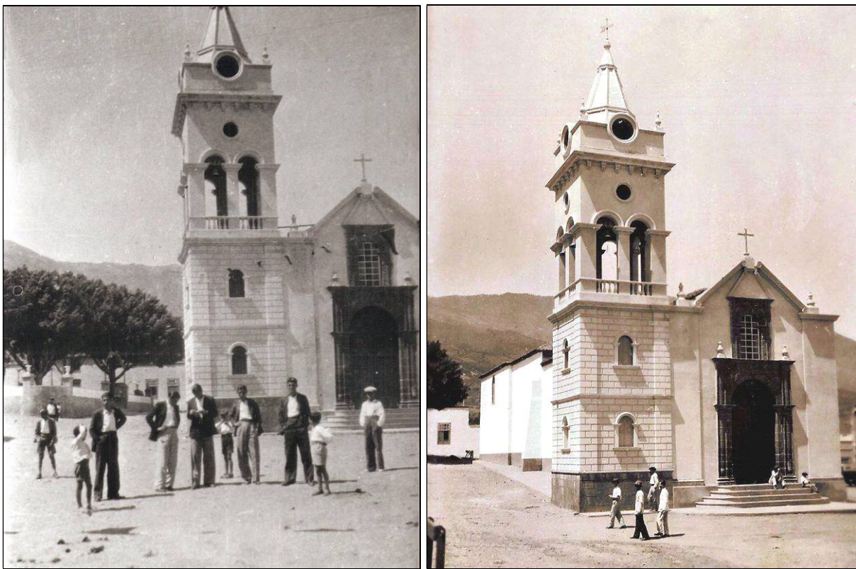
La torre terminada, pero aún sin el reloj y con las aceras del lateral oeste del templo ya construidas.

Como diría Pedro Tarquis, la torre de la iglesia parroquial de Arafo fue levantada “ con mejor o peor acierto en este siglo XX, pero con la buena idea de engrandecer el templo ” 9 .