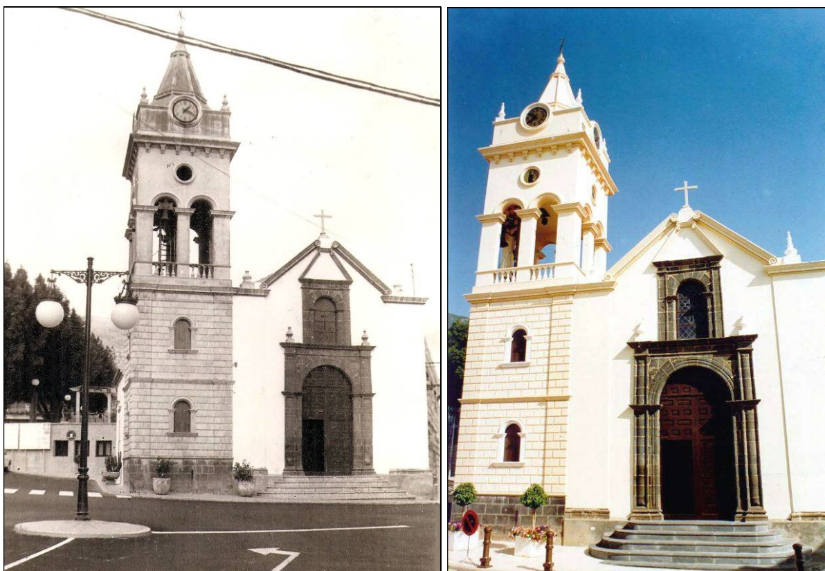
La iglesia de San Juan Degollado, una vez dotada con su torre y su reloj.