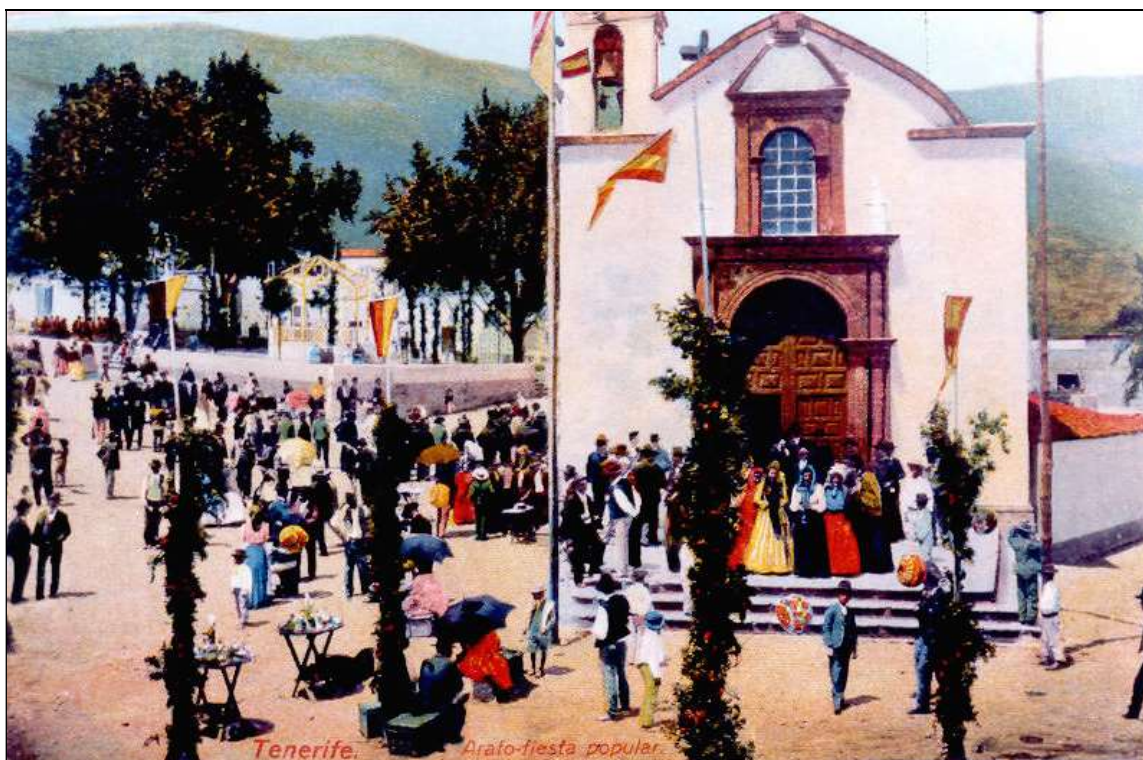
La iglesia de San Juan Degollado a comienzos del siglo XX, con su campanario y aún sin la torre.

En el presente artículo nos vamos a centrar, sobre todo, en el proceso de construcción de la torre de la iglesia parroquial y en la posterior instalación de un reloj público en misma.