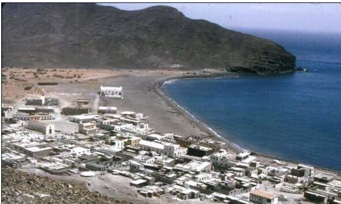
Gran Tarajal en una antigua fotografía de don Rafael Morales Méndez [Reproducida por Canarias7].

correspondencia, destacando: “los poemas, a la manera de Espronceda, que enviaba su abuelo paterno a casa por Navidades y que su padre recitaba con amor filial” 18 .