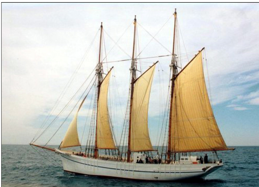
Un pailebot de tres mástiles.