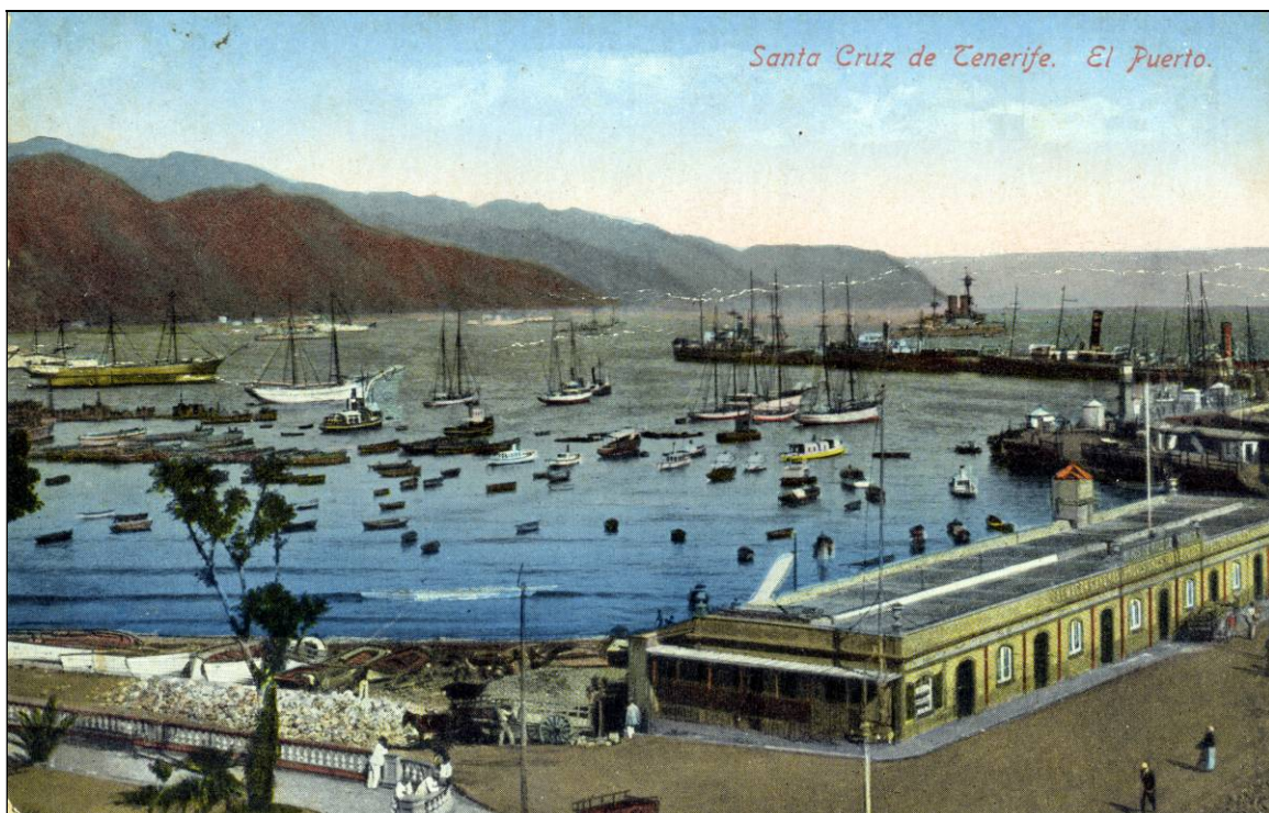
Numerosos veleros de cabotaje en el puerto de Santa Cruz de Tenerife, a finales del siglo XIX.

En estos días ha circulado por aquí la alarmante noticia de que el buque del cabotaje Tinerfe , que salió del fondeadero de Lulaya de esta jurisdicción con un fuerte viento del NO, en la tarde del 25 de Marzo último cargado de losas, y otros efectos y con pasajeros para ese puerto, naufragó esa misma tarde frente á la punta de Güimar. Créese que esta noticia no pase de ser una conjetura deducida del mal tiempo con que navegaba dicho buque, de la mucha carga que llevaba, del no haber llegado aun á ese puerto y de que parece hay personas que dicen le perdieron de vista frente á la indicada punta. Sin embargo, á ser cierto, como hoy se dice de público, que en la playa de los cristianos, jurisdicción de Arona, arrojó el mar ahora 4 ó 5 dias el cadáver de un hombre que hacia viage en aquel buque, y que en otros puntos de estas costas se han encontrado algunos objetos de los que se sabe iban á su bordo, ya hay motivos para creer cierta una noticia que nos alegraríamos infinito resultara totalmente falsa. 7