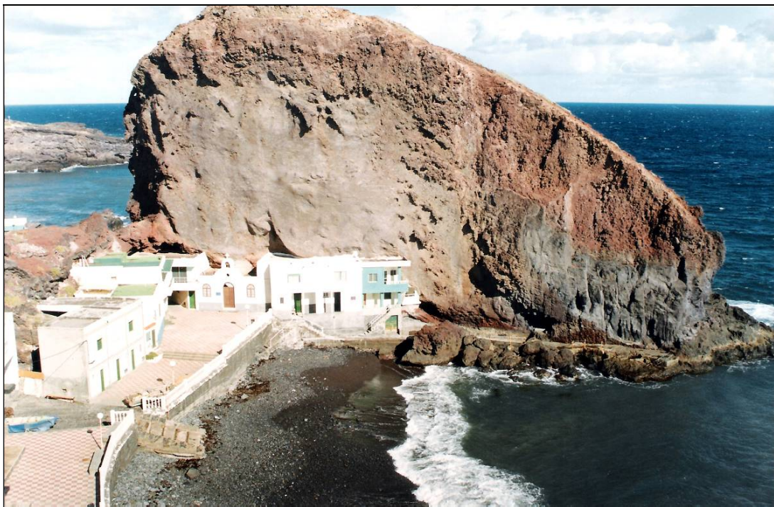
El puerto de Los Roques, al abrigo de los dos accidentes que le dan nombre, permitió operar simultáneamente a varios veleros.

Además, en Los Roques existió un horno de cal, en el que se trataba la piedra procedente de Lanzarote y Fuerteventura; el producto elaborado era utilizado en la construcción y albeo de las casas del término municipal, incluyendo la iglesia parroquial; continuaba en uso en 1907. Ocasionalmente, los barcos operaban también por Las Eras, con el fin de intercambiar mercancías con el exterior.