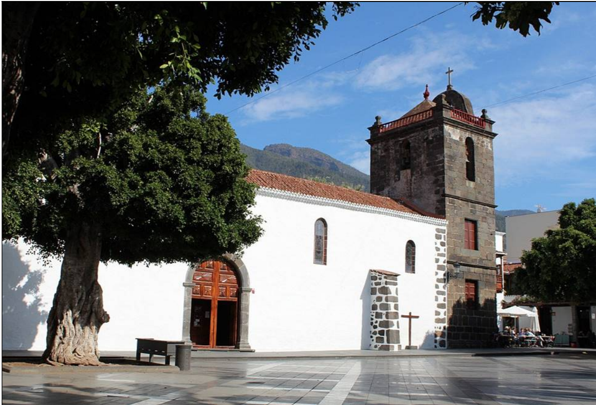
Don Juan Reyes Pérez ejerció durante ocho años como párroco-arcipreste de Los Llanos de Aridane, de donde también fue nombrado Hijo Adoptivo.

un día inolvidable y gratisimo, al ser colocada la primera piedra de la Iglesia de San Pío X, efectuara la bendición. 31