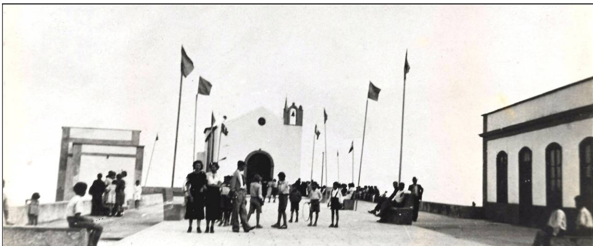
En 1867 se aprobó por primera vez la creación de la parroquia de San José en El Escobonal