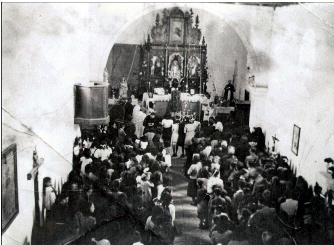
Interior de la antigua iglesia de San José, desaparecida en un incendio, sede inicial de la parroquia creada en 1929.

Mientras la creación parroquial se dilataba, para favorecer la asistencia al culto, los párrocos encargados de las ermitas de El Escobonal celebraban en ella la mayoría de los bautismos y matrimonios, a los que se unieron desde 1919 los entierros, tras la construcción del cementerio de este pueblo, aunque por no ser parroquia las correspondientes partidas tenían que asentarse en los libros parroquiales de San Pedro Apóstol; pero gracias a ello se evitaba el desplazamiento de los agacheros hasta Güímar para la celebración de los distintos sacramentos.