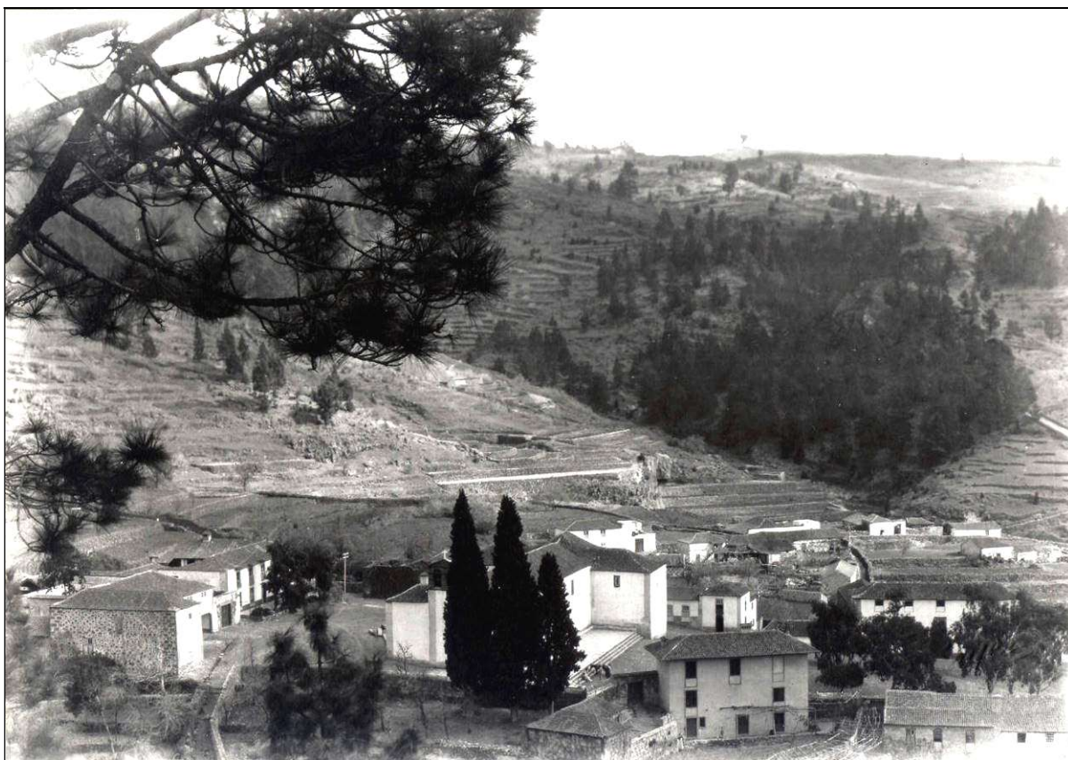
Vilaflor de Chasna.