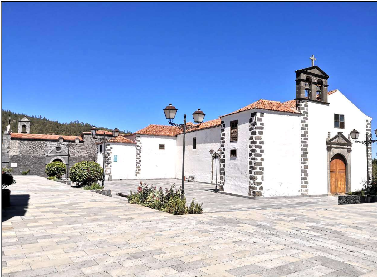
Iglesia parroquial de San Pedro Apóstol, sede principal de la Misión.

En el municipio de Vilaflor de Chasna se establecieron dos centros misionales, uno en la cabecera municipal y otro en Jama. Llama la atención que no se pusiese un centro misional en La Escalona, a pesar de su aislamiento y contar con una considerable población, por lo que suponemos que dichos vecinos debieron acudir a la cabecera municipal. A continuación, vamos a analizar como tuvo lugar la Santa Misión en este término, tal como fue descrita por los propios misioneros que la llevaron a cabo en ambos centros misionales, lo que nos permite conocer como era por entonces la vida religiosa y social en los distintos núcleos que integraban el término municipal, con datos a veces curiosos.