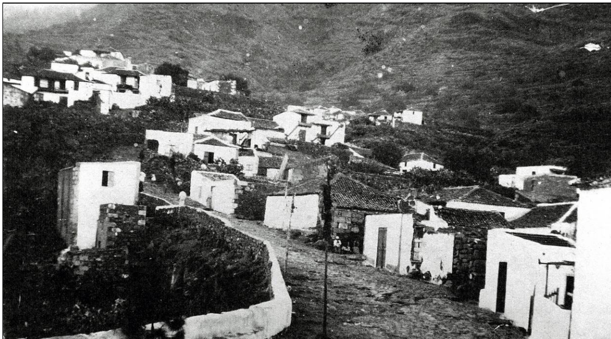
En 1936 se constituyó la Federación Obrera de Igueste, de corta trayectoria.