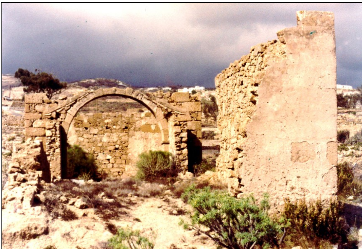
Ruinas de la iglesia vieja de San Joaquín de Fasnia, primer templo parroquial de Fasnia y primer local de elecciones y sesiones del Ayuntamiento.

El 29 de junio de 1808, tras el alzamiento de Madrid contra la invasión francesa, el comandante general Casa-Cagigal envió una comunicación al Cabildo de La Laguna, expresando la conveniencia de reunirse un Cabildo abierto, ante las circunstancias políticas en que se hallaba la Monarquía y la variedad de opiniones que se habían formado sobre la suerte de la provincia, con el fin de tomar medidas precautorias para asegurar la tranquilidad de los naturales y la seguridad de sus propiedades. Atendiendo a lo solicitado, el 11 de julio de dicho año se celebró dicho Cabildo general abierto, asamblea considerada la más importante de cuantas había celebrado el archipiélago canario, a la que concurrieron más de 80 representantes, bajo la presidencia del corregidor don José Valdivia y Legovien. Sin otra mira que la salvación de los intereses nacionales y regionales amenazados, resolvió el problema de la centralidad de la provincia, planteado con el régimen unitario y centralizador de la Casa de Borbón, si bien a costa de dolorosas desavenencias entre las islas hermanas. Además, se juró adhesión al Rey Fernando VII y a sus legítimos sucesores, y se acordó constituir una Junta que asumiese todos los poderes, desde el militar hasta el judicial. Los representantes del pueblo de Fasnia en esta importante asamblea fueron don José Díaz Flores y don Gaspar Delgado y Baute. 4