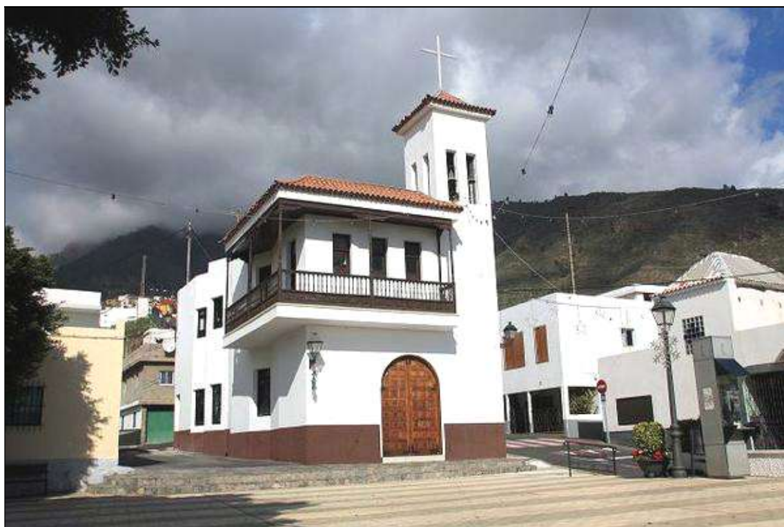
La Sociedad “El Porvenir de Araya” fue el único centro de recreo y cultura con el que contó en la posguerra el barrio de Araya de Candelaria.