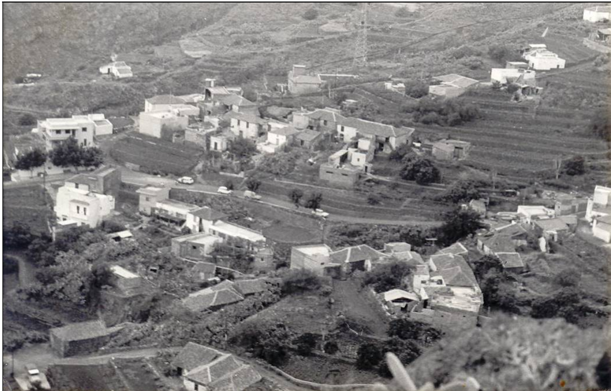
Don Nicolás ejerció en Igueste como maestro sustituto, secretario de la Sociedad “Juventud Iguestera, defensor del Partido Republicano Tinerfeño y somatenista.

Además, se afilió al Partido Republicano Tinerfeño, del que fue uno de sus principales impulsores, un verdadero paladín en Igueste de Candelaria.